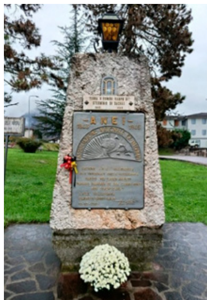
Il monumento A.N.E.I. a Sabbio Chiese.

Durante questi viaggi gli studenti tedeschi e italiani si sono recati presso il monumento A.N.E.I., dove si è svolto un momento commemorativo per ricordare i 59 giovani valsabbini morti nei campi di lavoro e nei lager nazisti. Gli studenti hanno ripercorso la storia e il significato di questo monumento, spiegando l'importanza di conoscere il passato per rendere viva la memoria di chi ha sacrificato la propria vita per farci vivere un futuro migliore di collaborazione e di pace. ●