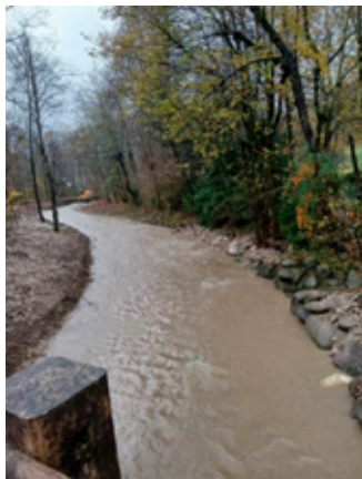
Intervento Parco Fratta