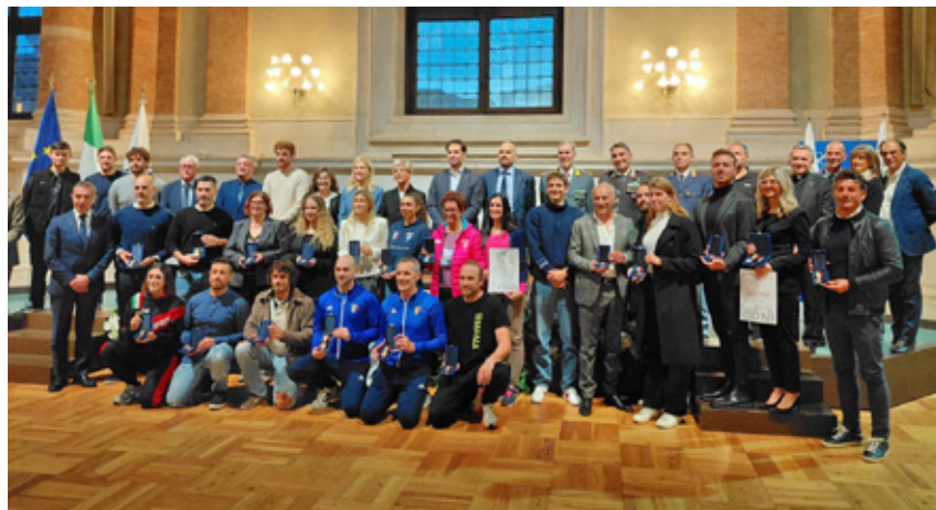
Premiazioni al merito sportivo nel palazzo Vanvitelliano di Brescia