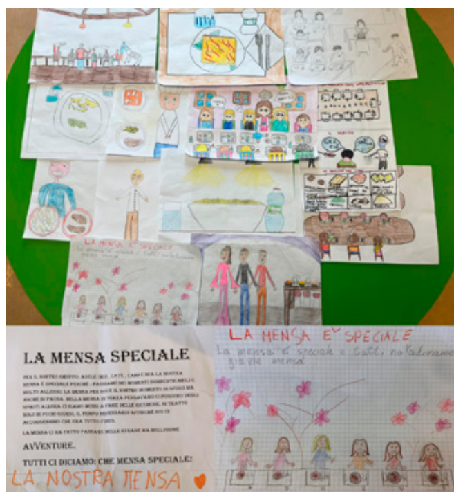
I bambini disegnano la "loro" mensa.

L'Amministrazione Comunale ha deciso di sostenere anche quest'anno il servizio mensa, nella convinzione che rappresenti un importante supporto per le famiglie e un valore aggiunto per la comunità scolastica. Tuttavia, è doveroso riportare che, negli ultimi anni, parallelamente all'incremento del numero di iscritti, si è registrato un maggior numero di osservazioni da parte dei genitori, in particolare sulla scelta del menù, sul costo del buono pasto e sulla qualità delle pietanze. Su questi aspetti l'Amministrazione ha sempre garantito la massima attenzione e trasparenza, grazie anche