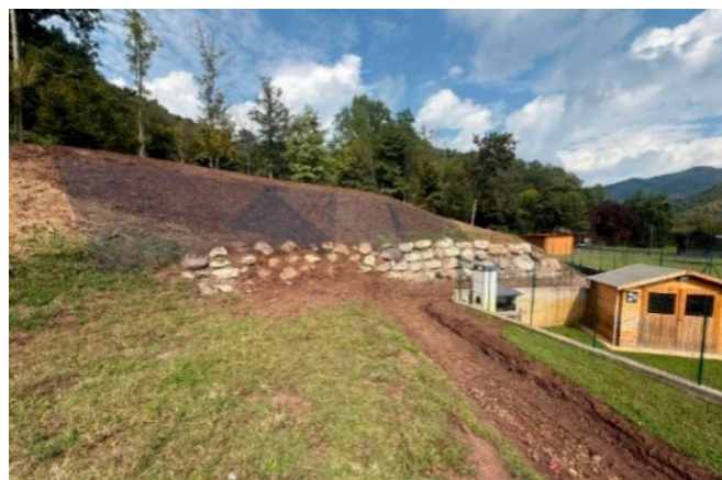
Intervento di messa in sicurezza versante montano loc. Cleten/Tesa.