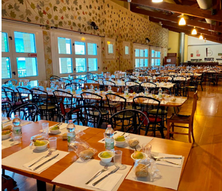
Il locale del Bistrot (ex Pepolino) che ospita la mensa scolastica.

I numerosi sopralluoghi effettuati dall'Amministrazione Comunale hanno confermato la qualità dei pasti: porzioni abbondanti, pietanze gustose e personale attento e premuroso. Tuttavia, spesso alcuni bambini non consumano completamente i pasti o non arrivano nemmeno ad assaggiarli, contribuendo a un significativo spreco alimentare. Questo comportamento può essere influenzato da abitudini per-