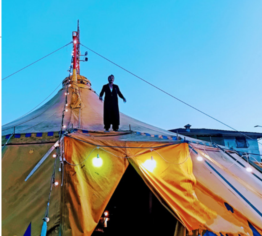
Fuori dal circo

Il sincero ringraziamento della Commissione Cultura va a tutti i partecipanti al contest. ●