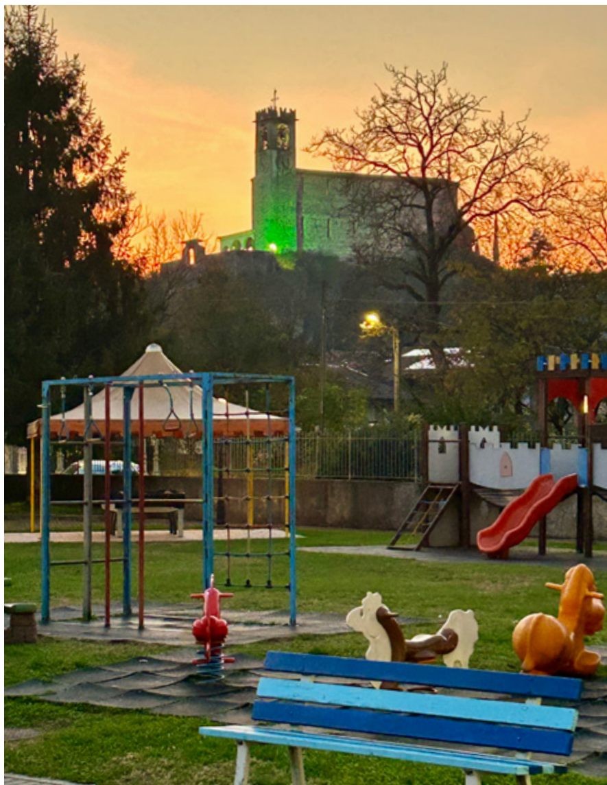
Tramonto sul parco Bertella