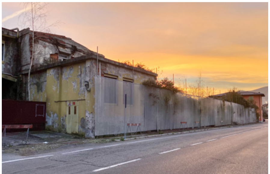
Lo stabilimento abbandonato nell'area ex-Pasotti.

venzione Urbanistica, stipulata fra la proprietà ed il Comune nella quale furono definite le aree di cessione: 638,53 mq. per opere di urbanizzazione primaria e 503,69 mq. per formazione della strada di collegamento e la monetizzazione del 10% della volumetria realizzabile, quantificata in 342.800 € ed interamente già versata dalla proprietà (Immobiliare Pasotti). La valutazione di stima del compendio immobiliare tiene conto dell'inquinamento del sottosuolo nonché degli oneri da sostenere per rendere l'area edificabile secondo quanto emerso dal Piano di Caratterizzazione del sito approvato dall'Amministrazione