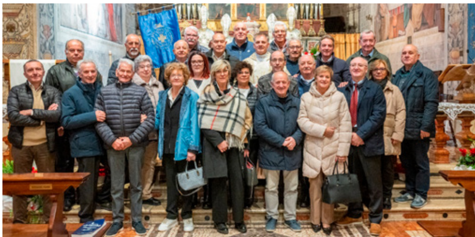
Volontari Ambulanza riuniti nella chiesa Parrocchiale.