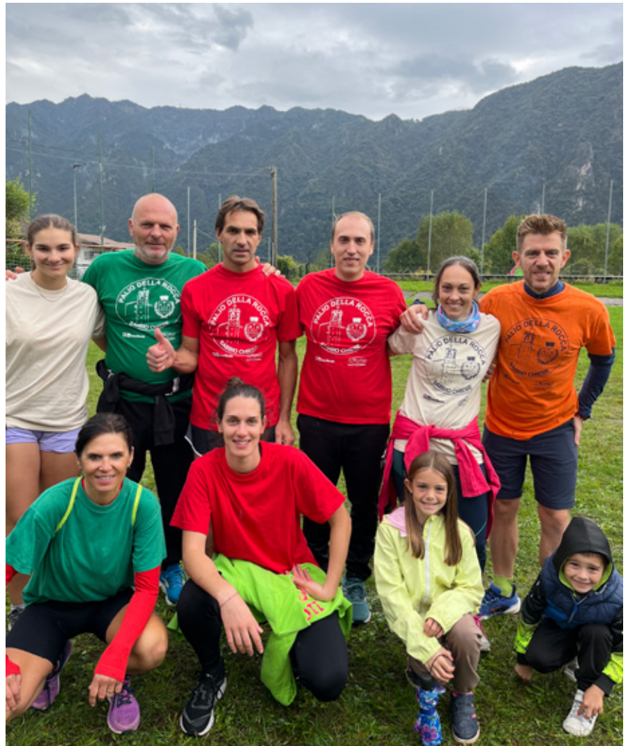
Il team della Commissione Sportiva di Sabbio Chiese.

La nostra squadra è stata guidata dalla Commissione Sportiva che ha deciso di portare la tradizione del nostro Palio indossando le diverse