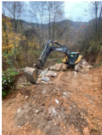
Intervento Rio Selva - Clibbio

La Giunta della Regione Lombardia ha approvato un nuovo piano di contrasto al dissesto idrogeologico, che stanziava oltre 19 milioni di euro per interventi urgenti a difesa del suolo in undici province lombarde. All'interno dell'elenco sono compresi interventi di manutenzione dei corsi d'acqua, consolidamento dei versanti e mitigazione del rischio idraulico. Con queste risorse aggiuntive è stato possibile scorrere la graduatoria del Bando Dissesti 2024 e finanziare nuovi progetti idonei ma precedentemente esclusi per esaurimento fondi. Per quanto riguarda il nostro territorio l'intervento richiesto riguardava la messa in sicurezza del Rio Preane - appartenente al Reticolo Idrico Principale di competenza regionale. Il progetto dei lavori redatto dall'U.T.R. Brescia e finanziato per intero da Regione Lombardia ha riguardato la sistemazione idraulica del tratto del torrente Preane nella zona adiacente il Parco La Fratta. La messa in sicurezza del torrente e la salvaguardia del territorio circostante, richiede ulteriori interventi che sono stati oggetto di segnalazione alla competente struttura di Regione Lombardia.