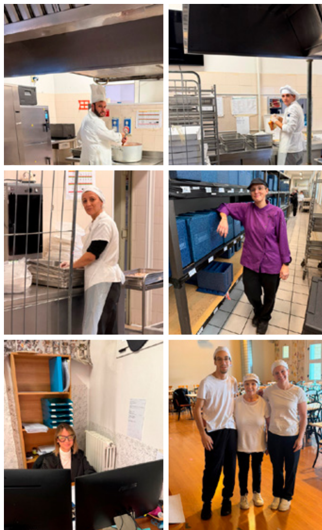
Personale al lavoro al Coop.Ser. Bistrot.

Il subentro è stato graduale. Dopo un primo investimento per il ripristino dei locali, la cooperativa ha servito inizialmente circa 130 pasti al giorno. La vera svolta è arrivata nel 2018, quando, a seguito della crisi della principale ditta committente, Coop.Ser. ha rimodulato il servizio, puntando sulla produzione di pasti veicolati