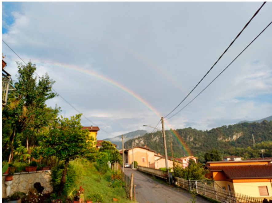
Arcobaleno a Pavone

Altri soggetti che hanno arricchito la raccolta: il parco di Sabbio sopra in Via Sole, ritratto mentre sbocciano i ciliegi, il cortile dell'Oratorio, vie e strade immortalate sia di giorno che in notturna, il piazzale del Municipio durante i