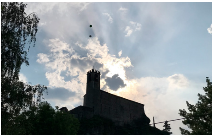
Palloncini in volo sulla Rocca - foto di Veronica Gabrieli