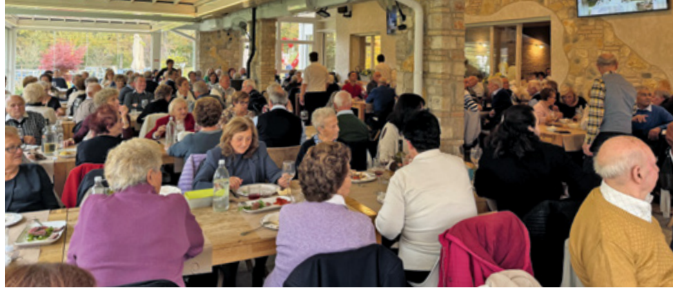
Il pranzo nella giornata dedicata agli anziani.