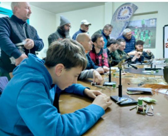
Pesca a mosca, un momento del corso

poter entrare nel ristretto cerchio dei partecipanti al Campionato del Mondo, ma nel frattempo godiamoci insieme questo fantastico risultato.