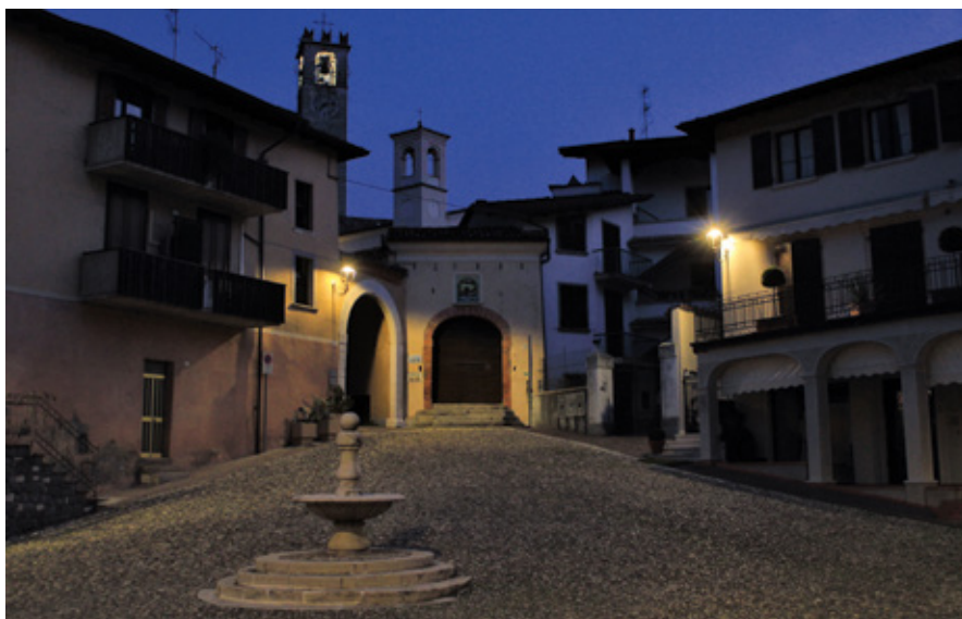
Scende la sera