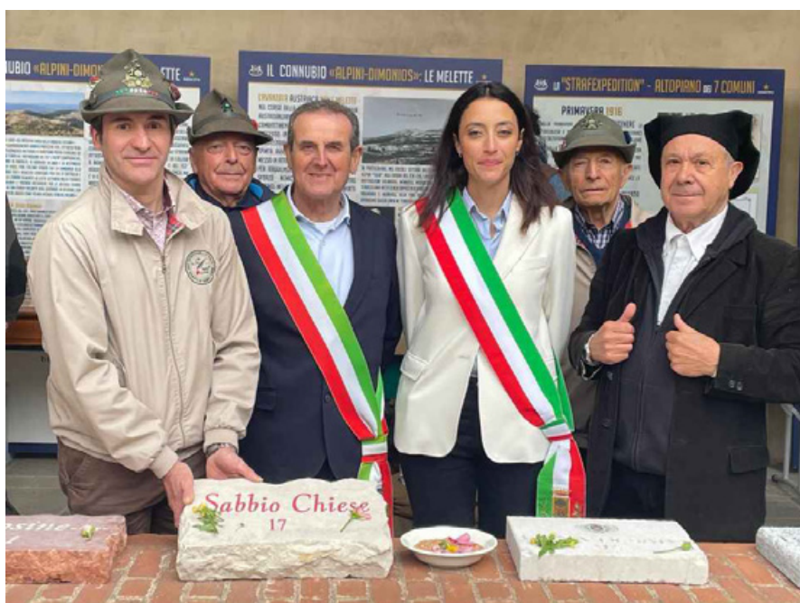
Il ricordo nella pietra - Cerimonia di consegna al Nuraghe Chervu di Biella.

Non c'erano bandiere che sventolavano al vento né fanfare a spezzare il silenzio. C'era solo il suono grave della memoria che si depositava, pietra dopo pietra, su un terreno che ogni giorno diventa sempre più sacro. Ogni lastra racconta una storia. Ogni incisione è una cicatrice che continua a pulsa-