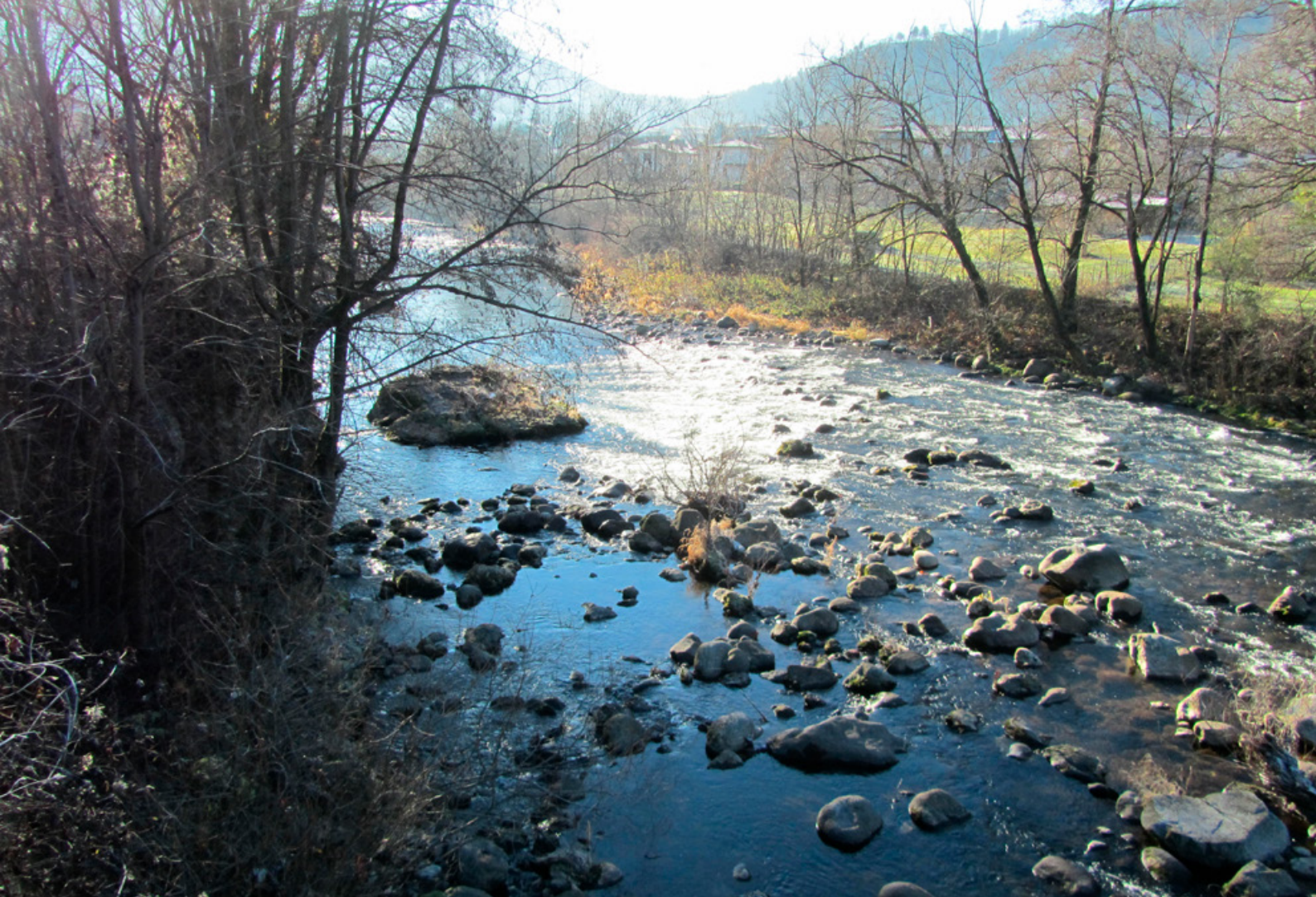
Figura 2 - Zona ipotetica di realizzazione sbarramento centrale idroelettrica “La Rocca”.