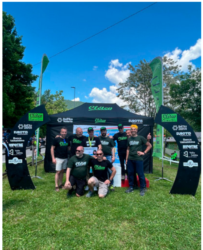
Grande successo - Organizzatori sul podio della manifestazione.

Oltre 300 atleti hanno colorato la giornata, accompagnati da familiari, tecnici e appassionati provenienti da tutta la Lombardia e da diverse regioni del nord Italia. Il colpo d'occhio verso la Rocca di Sabbio Chiese, con il parco sportivo animato da sorrisi, fatica e spirito di squadra, ha regalato un'immagine di comunità viva e accogliente.