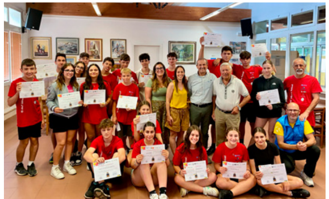
Ci sto? Affare fatica! - Autorità e gruppo al completo.

Oltre al valore pratico degli interventi, il progetto ha rappresentato un momento formativo e di crescita per tutti i partecipanti. I ragazzi hanno ricevuto un insegnamento importante: il bene comune ha bisogno di essere curato e il nostro paese è più bello e vivibile se tutti ci impegniamo a renderlo tale. In questa settimana hanno potuto comprendere concretamente che le