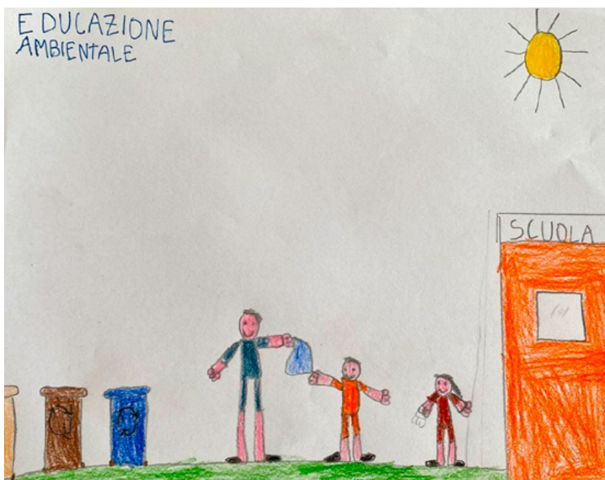
Da casa a scuola - Il concetto di riciclo consapevole nel disegno di un alunno.

Con la collaborazione delle famiglie è diventata un’abitudine consolidata: attrezzati con porta merenda riutilizzabili, si consu-