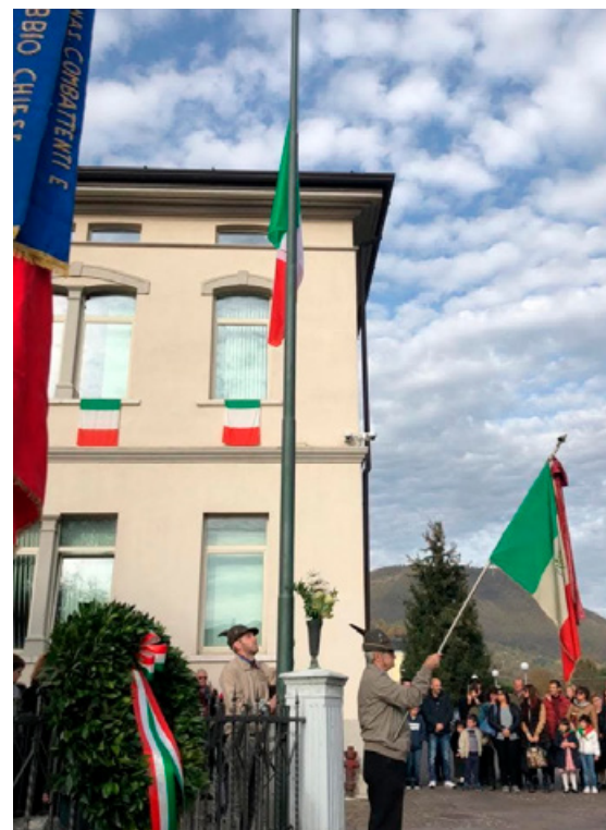
Italo Alpino durante una cerimonia ufficiale.

E allora grazie di tutto Italo, sibi tibi terra levis. ●