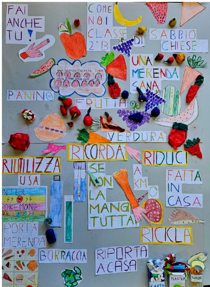
Vittoria! - Il manifesto vincitore del contest organizzato da SAE Valle Sabbia.

Mi sono sentita veramente contenta su quel palco perché, oltre al premio ricevuto, il segreto per andare avanti è iniziare dalle sane abitudini per costruire un futuro migliore.