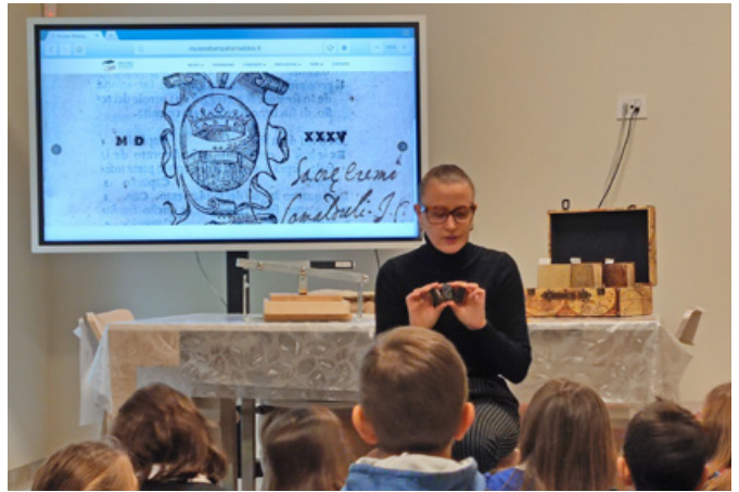
Proposte educative - Due momenti delle attività del Museo dedicate ad adulti e ragazzi.

ponti ha portato i piccoli esploratori tra Roma, Venezia e Trento – città dove i nostri stampatori hanno lavorato - per riflettere sull'importanza delle relazioni, dei "ponti", che li legano con il mondo e le persone che li circondano. Esperienze ricche di significato, che hanno unito creatività, storia e condivisione e che si sono concluse, a fine anno, con l'appuntamento Imprinting. Prove di Stampa , offerto in collaborazione con il Sistema Museale della Valle Sabbia, cui il museo Stampatori ha aderito ad aprile 2024. Nei prossimi mesi sono già in fase di progettazione ulteriori attività che saranno comunicate a breve. Vi anticipiamo qui che il filo conduttore sarà... La stampa si fa con tutto.