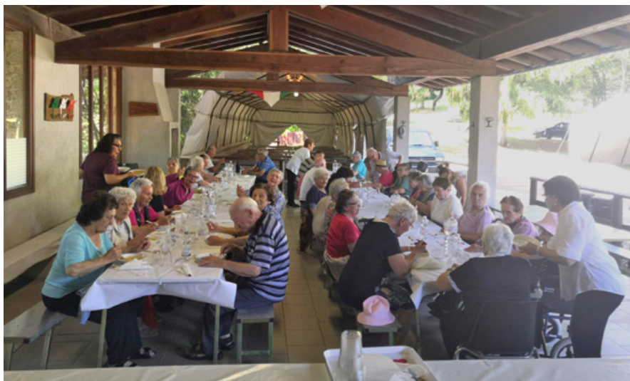
Sant'Onofrio - Una delle iniziative messe in campo per gli ospiti della Casa di Riposo.

Servizio di assistenza sociale di base: il servizio di assistenza so-