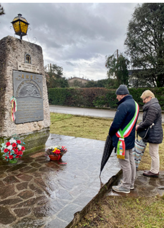
Giornata della Memoria Commemorazione al monumento ANEI che ricorda i giovani valsabbini morti nei lager nazisti

P er dare continuità alle fitte relazioni che, da diversi anni, legano Sabbio Chiese alla città di Kassel, nell'Assia settentrionale, la Scuola Secondaria di I grado ha proseguito il progetto europeo “School beyond borders - Scuola senza confini” con la “Erich Kästner Schule” di Baunatal che, dal 2022, condivide con il nostro Istituto Comprensivo un percorso di scambio culturale in lingua inglese.