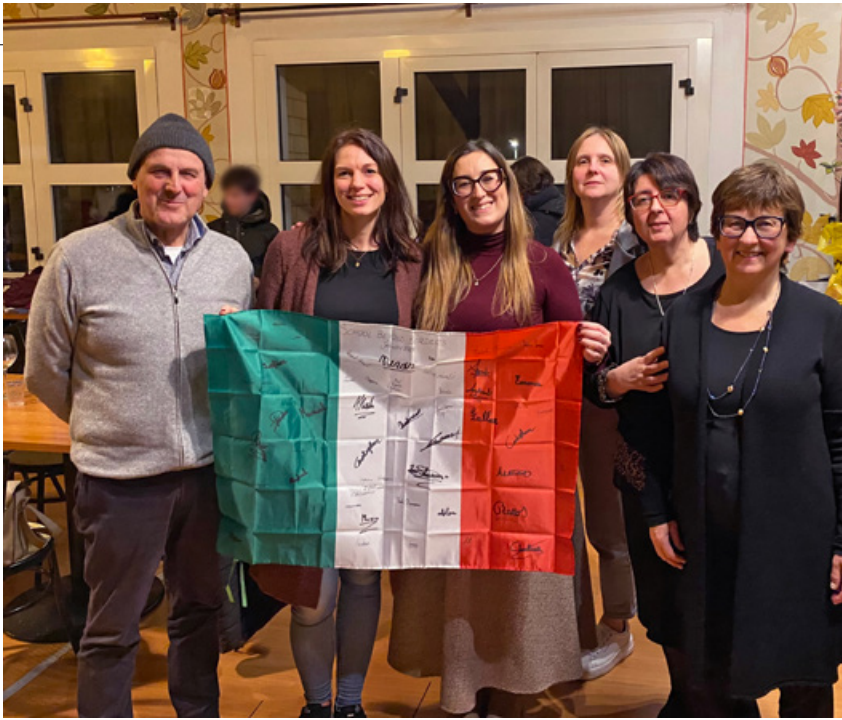
Insieme - Le firme di tutti sulla bandiera italiana.

Giorno della Memoria. I nostri ragazzi hanno ripercorso, in inglese e in italiano, il significato e la storia di questo monumento, spiegando l'importanza di conoscere il passato per rendere viva la memoria di chi ha sacrificato la propria vita per farci vivere un futuro migliore di collaborazione e di pace.