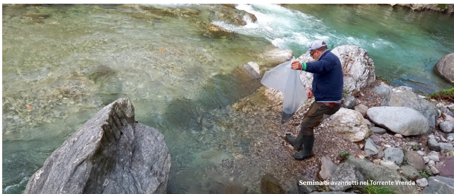
Semina di avannotti nel Torrente Vrenda

Come per tante altre discipline sportive, anche per l'ASD Pescatori Sabbio Chiese è giunto il tempo della nuova stagione agonistica di pesca alla trota torrente.