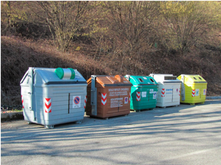
Cassonetti. Verranno dismessi nei primi mesi del 2025. Fino al 2018 receprivano 5 tipi di rifiuti.