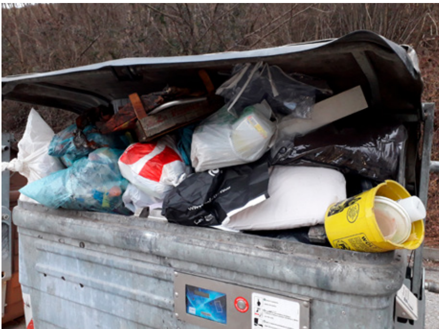
Inciviltà. Uno dei motivi che hanno portato alla rimozione dei cassonetti stradali.

viene in aree specifiche per effetto emulativo ovvero per imitazione, a dimostrazione dell'ipotesi che un ambiente pulito chiama al rispetto dei luoghi mentre un ambiente alterato richiama al cattivo vizio, alla contaminazione e al degenero. Intenzione dell'Amministrazione Comunale, del Gruppo di Lavoro Ecologia e Ambiente, degli operatori comunali e delle forze dell'ordine è sicuramente quella di continuare a contrastare il fenomeno di abbandono dei rifiuti non nascondendo la