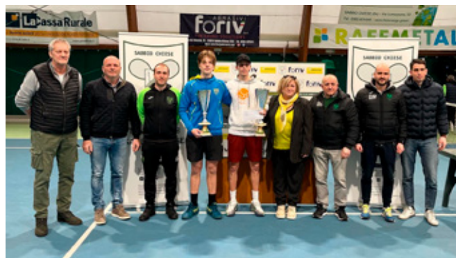
Memorial Enzo Borghetti. La premiazione.

Vi diamo appuntamento a marzo 2025 con la seconda edizione del Memorial Enzo Borghetti. Lui vivrà sempre dentro di noi. ●