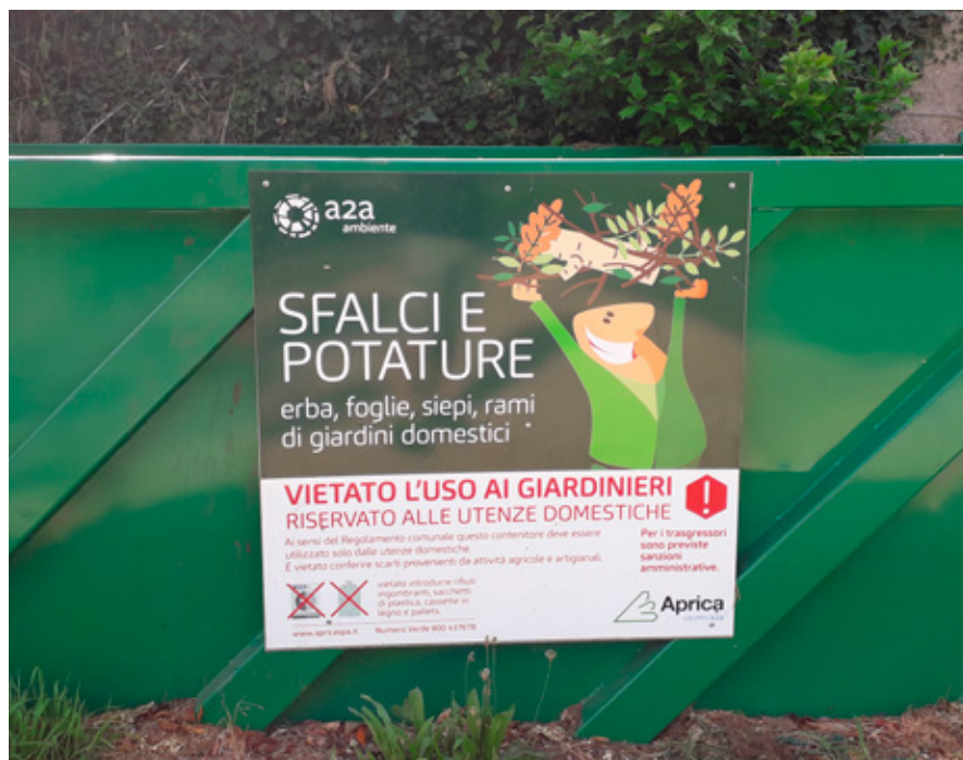
Green Box. I contenitori resteranno sul territorio a titolo sperimentale.

Si consiglia di esporre bidoni e sacchi preferibilmente quando necessario e possibilmente quando pieni in maniera tale da ottimizzare il lavoro di raccolta da parte degli operatori ed evitare continue