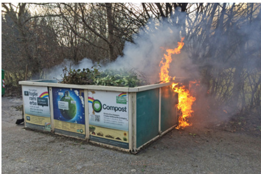
Incendio. Il fuoco divampa dalla cenere versata in un green box, distruggendolo e mettendo in serio pericolo la sicurezza dei luoghi, degli edifici e delle persone.