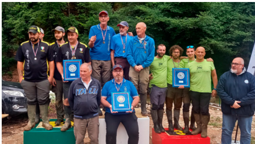
Terzo posto. La squadra di Sabbio sul podio dopo una dura battaglia.

Grazie a tutti i componenti della ASDP Sabbio Chiese che ci hanno incoraggiato credendo in noi. ●