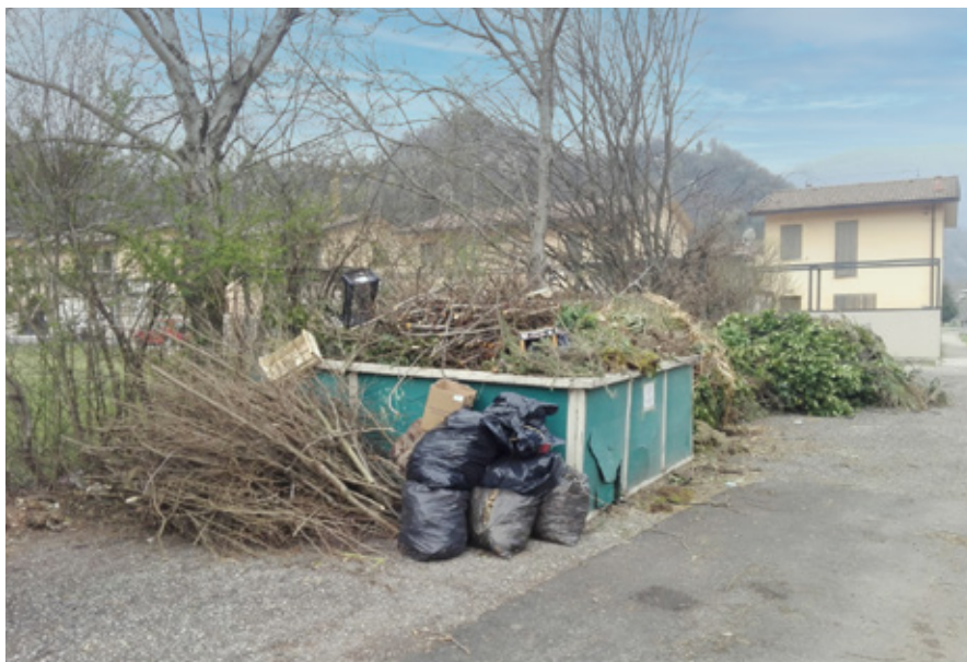
Inciviltà. Cattivo uso dei green box che, se continuato, ne porterà alla rimozione.