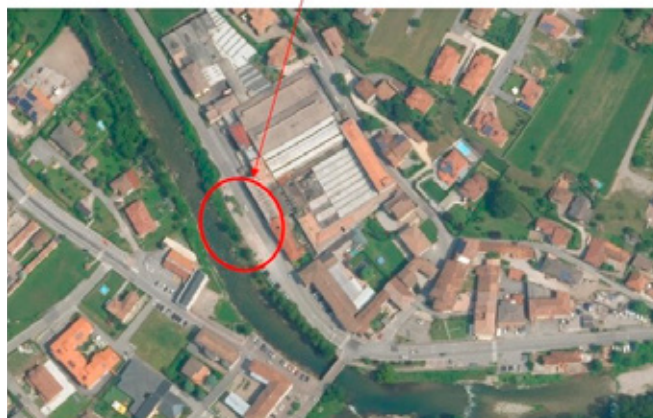
○ AREA PARCHEGGIO DA RIQUALIFICARE

Il costo dell'intervento, quantificato in 50.000 €, viene interamente finanziato dal contributo di Regione Lombardia all'interno del "Programma degli interventi per la ripresa economica - anno 2024".