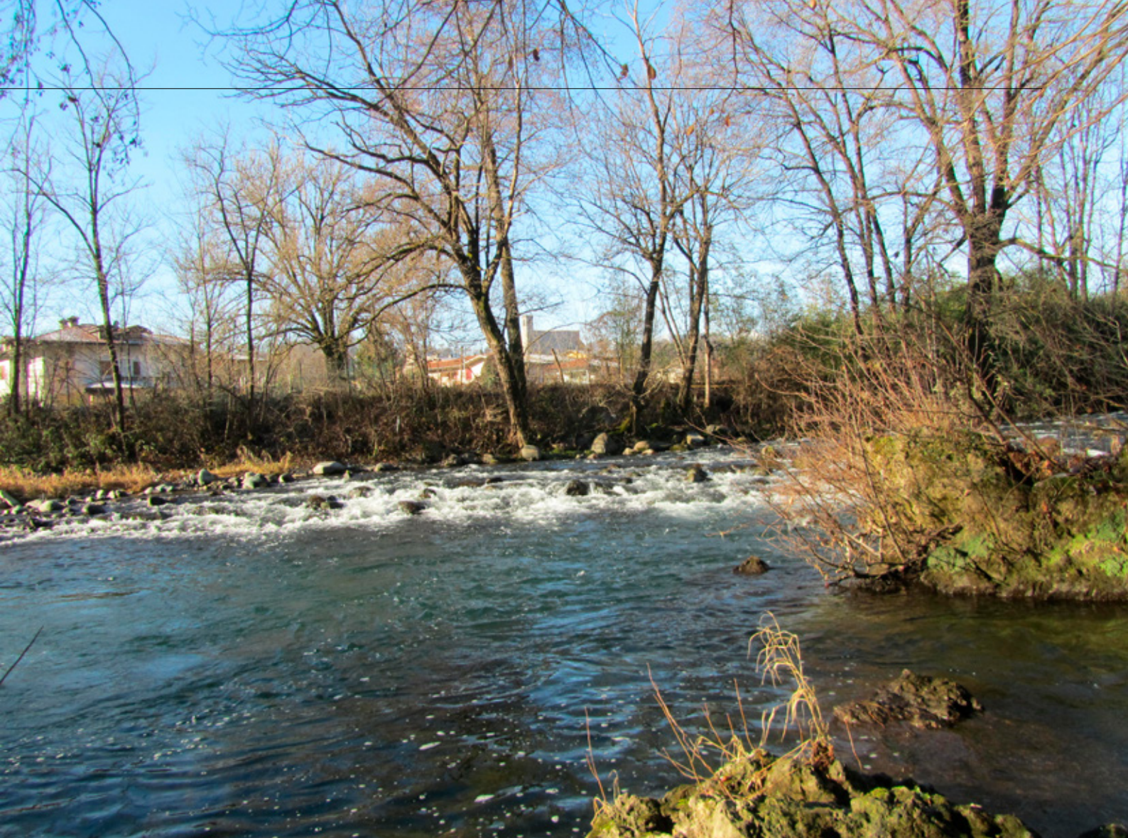
Centralina. Zona ipotetica di realizzazione della centrale idroelettrica “La Rocca”.

delle varie controparti che si sono espresse in merito al mantenimento del progetto di realizzazione dell'opera idroelettrica.