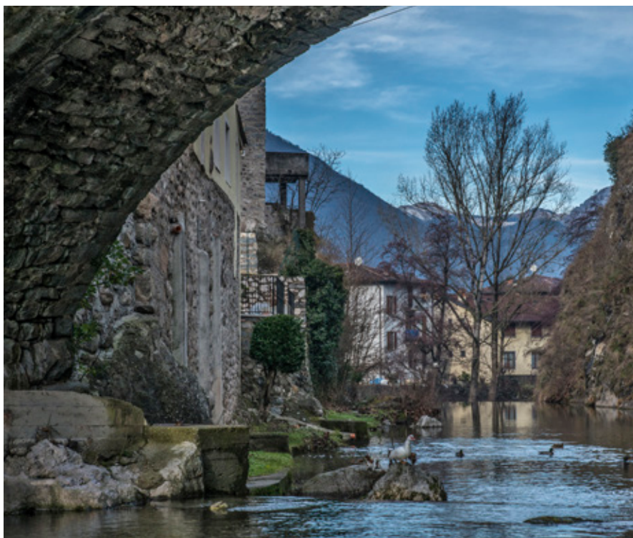
Il torrente Vrenda sotto il ponte di via Silvio Moretti

Predisponendo il bilancio previsionale, abbiamo adottato un atteggiamento prudentiale ma non rinunciatario, con azioni volte al mantenimento di importanti risorse sui capitoli di spesa del sociale, della scuola, della cura e gestione del patrimonio. La tassazione locale (Imu, Addizionale Irpef, Oneri Urbanizzazione, Servizi ecc.) è stata mantenuta invariata. Si registra un leggero incremento della Tari, dovuto principalmente all'aumento del prezzo dell'energia (petrolio, gas, energia elettrica) che, inevitabilmente si sono trasferiti sui costi di gestione del servizio di raccolta e smaltimento