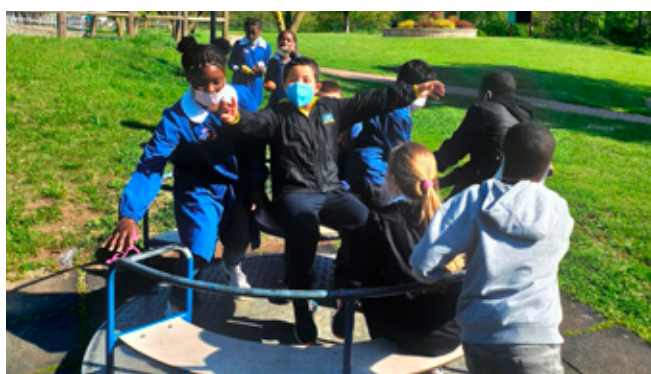
I piccoli autori con i compagni di classe

mo preparando il campo di guerra insieme agli ucraini, per affrontare i soldati russi. Ho sentito i bombardamenti, poi ho avvertito il fruscio delle foglie, come se ci fossero i soldati lì vicino.