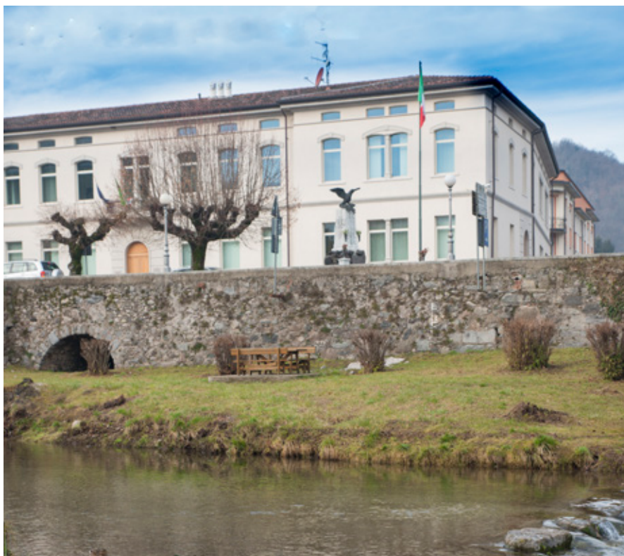
Il palazzo del municipio visto dal torrente Vrenda

Il documento di bilancio evidenzia un andamento, sperato ma non scontato, più che proficuo in tutti i suoi indicatori principali. La diminuzione dei residui attivi, del fondo Crediti di dubbia esigibilità, il pieno rispetto dei parametri deficitari ai fini dell'accertamento della condizione di ente strutturalmente deficitario, mettono in