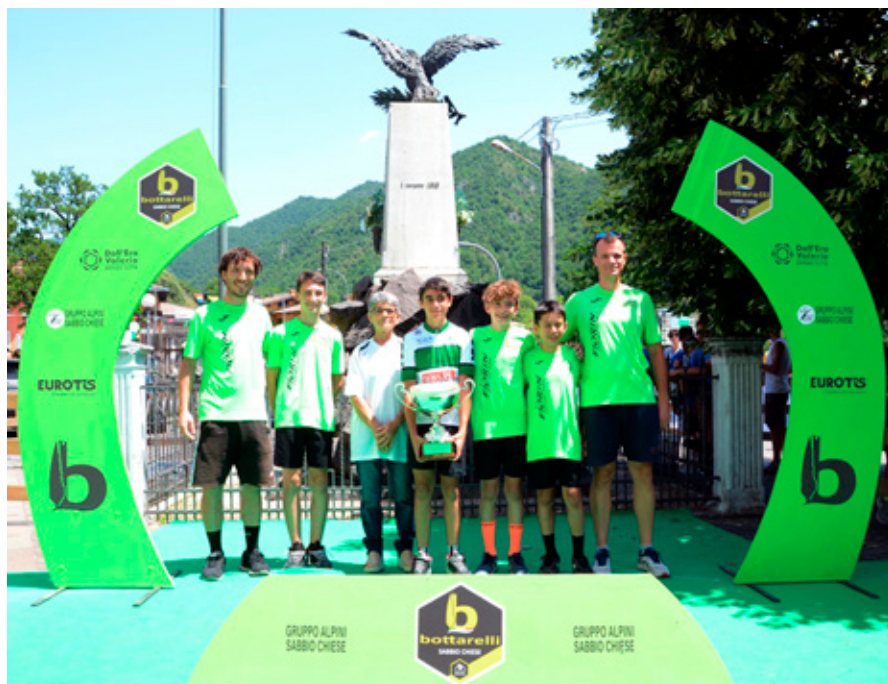
Cicli Fiorin vincitore al Memorial Bottarelli 2022

Cinque volte grazie perchè ancora una volta Sabbio Chiese, i suoi