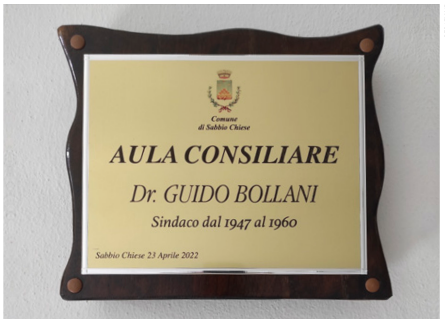
La targa di intitolazione posta nella Sala Consiliare del Comune