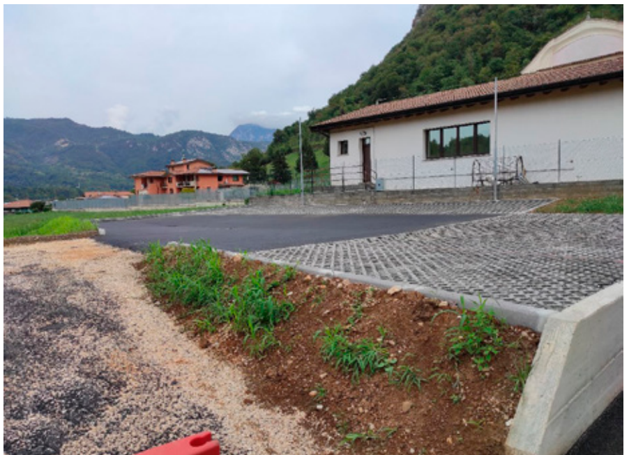
Foto 2 - Nuovo parcheggio realizzato in via S. Lorenzo

carico della gestione del Parco Cleten sono state tinteggiate le pareti esterne del magazzino (Foto 1).