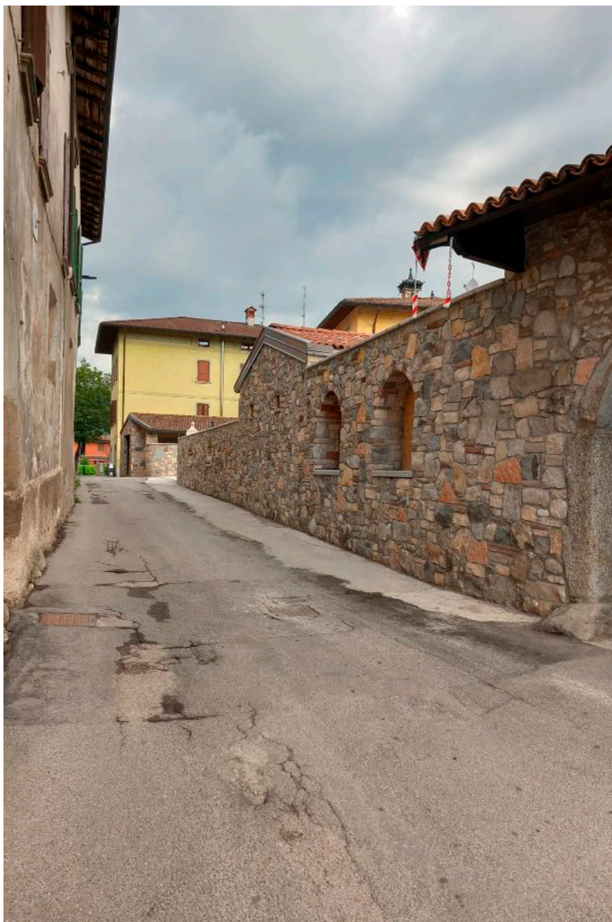
Foto 3 - I lavori di allargamento della strettoia di via Parrocchiale

Nel calendario delle opere pubbliche per l'anno 2022, è previsto uno stanziamento a bilancio di circa 200 mila euro per far fron-