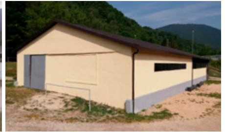
Foto 1 - Magazzino comunale prima e dopo i lavori di messa a norma e sistemazione