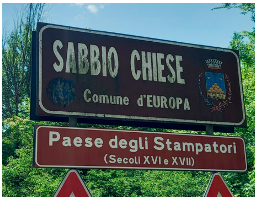
Il cartello stradale che riporta l’informazione turistica “Paese degli Stampatori”.

Da quel lontano 2012, esattamente dieci anni fa, in cui, in occasione delle Feste Decennali, venne allestita una piccola ma significativa mostra delle edizioni appartenenti al “tesoretto” comunale, la programmazione delle iniziative non si è fermata e, dopo la realizzazione di tre convegni, un progetto didattico, un calendario e la pubblicazione del “Quaderno / 0”, dal titolo Per gli stampatori ‘da Sabbio’. Uomini e storie prima del museo , si è concretizzata nel fattivo coinvolgimento degli studenti e delle studentesse che frequentano il corso di ‘Grafica’ (triennio) e di