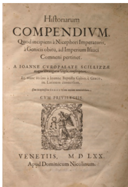
Un prezioso frontespizio del 1588, parte del patrimonio museale

che più utilizzate dagli stampatori, con l'obiettivo di fare sintesi del passato per rilanciare nuove idee, giungendo all'elaborazione di una "marca" aggiornata, di un "logo" come si dice oggi.