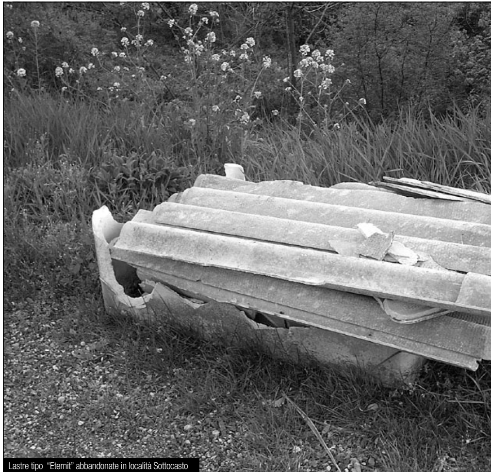
Lastre tipo "Eternit" abbandonate in località Sottocasto

dal bando di gara, verificate le offerte pervenute, il servizio è stato affidato alla ditta Ecoedile Srl di Bedizzole la quale ha formulato l'offerta economicamente più vantaggiosa a parità di condizioni. Alla società spetta il compito di organizzare l'intero ciclo operativo dell'intervento; alla definizione dei singoli costi in funzione delle quantità smaltite, alla richiesta dei permessi e delle concessioni, alla stesura delle relazioni tecniche da inviare all'ASL, alla rimozione e al