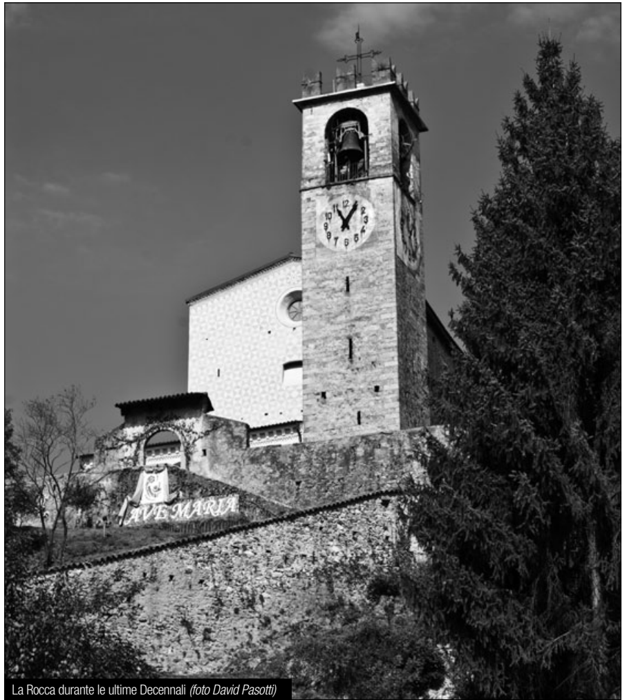
La Rocca durante le ultime Decennali

Il risultato raggiunto facilita la lettura della storia edilizia e permette di cogliere le molte sfaccettature artistiche. Inoltre porge l'invito a compiere un viaggio significativo nell'iconografia mariana attraverso gli affreschi ex voto che decorano in buon numero le pareti della navata della chiesa superiore.