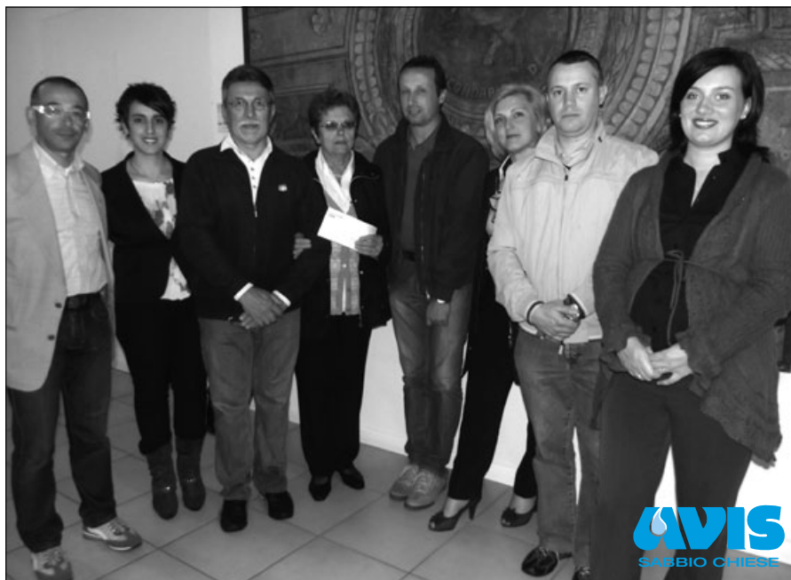
Tabella 1 - Consiglio Direttivo AVIS Sabbio Chiese 2013-2016

Per raccogliere bisogna prima seminare e poiché non vi è terreno più fertile come la scuola, è qui che da tre anni si concentra l'attenzione primaria mediante un progetto di propaganda che coinvolge le classi quinta elementare e seconda media. Per quest'ultima, in accordo con la dirigenza scolastica, viene organizzata una visita guidata alla sede Avis Provinciale a Brescia per consentire agli studenti di prendere contatto visivo con la moderna struttura che accoglie i donatori e percepisce il senso solidale rappresentato dalla dona-