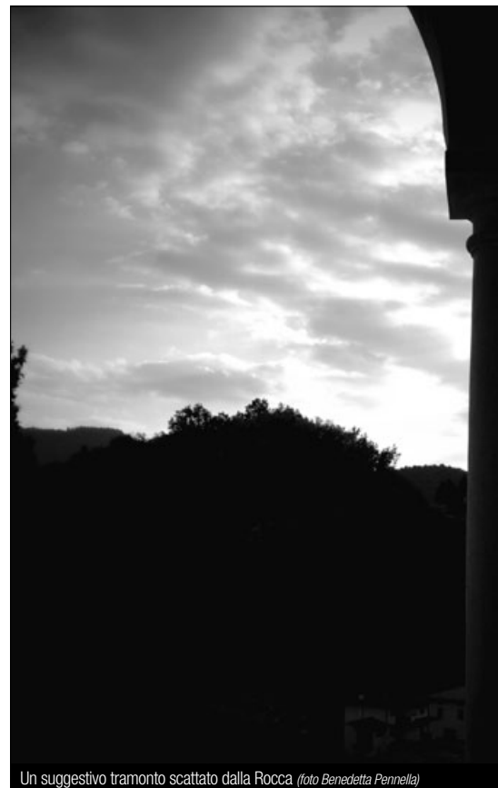
Un suggestivo tramonto scattato dalla Rocca

Il risultato complessivo è indovinato perché le tonalità più chiare slanciano meglio le volte della chiesa inferiore; l'articolarsi di ampie zone libere da affreschi e da appesantimenti, perimetrare solo da fasce decorative alle pareti e da costoloni che sottolineano meglio il disegno delle volte a crociera, permette una maggior lettura degli spazi architettonici tardo romanici e degli elementi gotici.