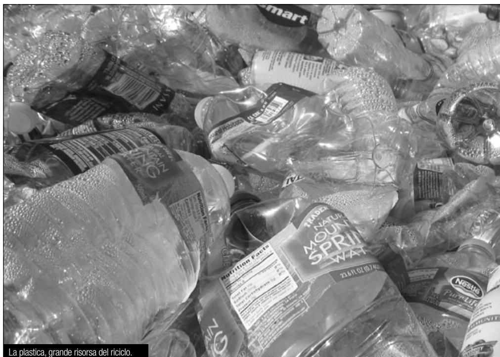
La plastica, grande risorsa del riciclo.

Il principale fattore che ci ha permesso di raggiungere già nel primo mese un valore così ragguardevole è innanzitutto la positiva risposta della cittadinanza sabbiese durante la fase di consegna delle "chiavette" (dispositivo per conferire nelle calotte), con valori di coperture pari a quasi il 90% delle utenze. Non è inoltre da sottovalutare la partecipazione a dir poco attiva della popolazione durante le attività di sensibilizzazione organizzate dall'amministrazione comunale in collaborazione con