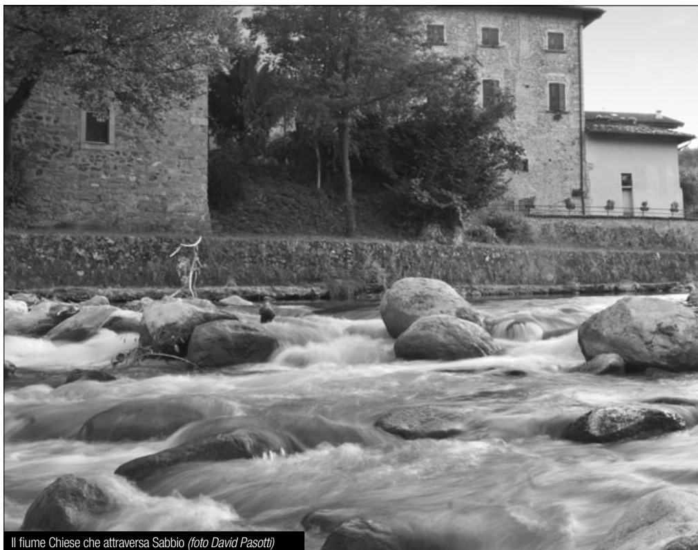
Il fiume Chiese che attraversa Sabbio

L'indagine realizzata ogni anno nell'ambito della campagna nazionale "Fiumi Sicuri", è dedicata alla prevenzione e all'informazione sul rischio idrogeologico. Il dossier ha l'importante obiettivo di scattare una fotografia sempre più aggiornata e dettagliata delle fragilità idrogeologiche del territorio italiano e valutare le attività messe in campo dalle Amministrazioni Comunali per la prevenzione e la mitigazione di tale rischio e sull'efficienza del sistema di protezione civile locale. Il problema della fragilità del territorio e dell'esposizione al rischio di frane e alluvioni riguarda in maniera preoccupante la maggior parte dei comuni italiani (circa l'82%), dall'indagine emerge innanzitutto l'inadeguatezza della difesa del