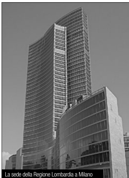
La sede della Regione Lombardia a Milano

“Regione Lombardia intende favorire la partecipazione dei giovani alla vita della comunità locale e sviluppare il senso di responsabilità individuale e collettivo dei giovani. Accanto ai tradizionali temi su cui intervengono le politiche giovanili, la cittadinanza attiva diventa uno strumento importante per la partecipazione dei giovani alla vita sociale quale contributo alla “costruzione del bene collettivo”. A tal fine, il presente bando, promuove progetti di cittadinanza attiva attraverso percorsi formativi destinati ai giovani da realizzarsi all'interno degli enti locali lombardi in un'ottica di sostegno e rilancio di percorsi innovativi in grado di coniugare la partecipazione attiva dei giovani ad opportunità di