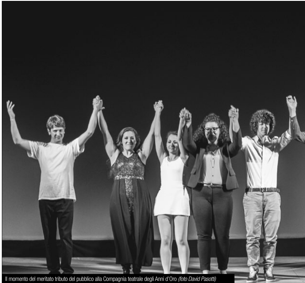
Il momento del meritato tributo del pubblico alla Compagnia teatrale degli Anni d'Oro

I personaggi che sono stati rappresentati siamo un po' tutti noi, sono i nostri vicini di casa, i nostri amici, i nostri familiari, tutti peccatori : c'è chi pecca d'invidia, chi di superbia, chi d'ira, chi di vanità. Ma in mezzo a tante imperfezioni e debolezze, c'è qualche raggio di luce? C'è qualcosa che può riscattarci da tutte le nostre mancanze? Essendo tutti peccatori,