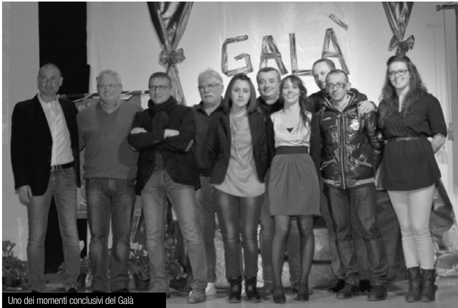
Uno dei momenti conclusivi del Galà