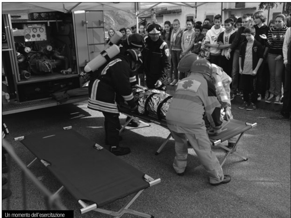
Un momento dell'esercitazione

Eppure i responsabili della sicurezza e delle varie operazioni di evacuazione dell'edificio, dal diri-