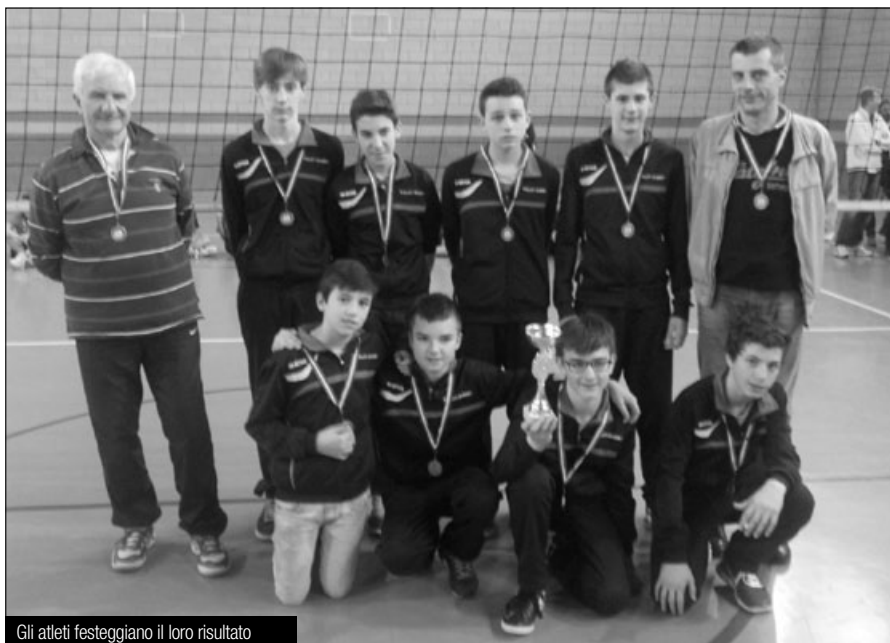
Gli atleti festeggiano il loro risultato