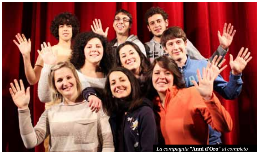
La compagnia "Anni d'Oro" al completo

Provocazione, reazione, riflessione. Ecco qual è stato il nostro scopo: abbiamo provocato, abbiamo mosso delle osservazioni, abbiamo fatto riflettere. Troppo trasgressivi? Forse. Ma non è stata trasgressione fine a se stessa. La nostra è una voce fuori dal coro, una voce che urla contro l'omologazione e l'ipocrisia, un grido destabilizzante in una matassa