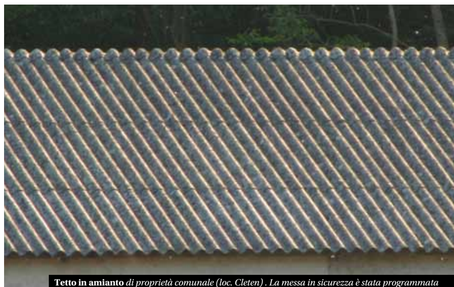
Tetto in amianto di proprietà comunale (loc. Cleten). La messa in sicurezza è stata programmata