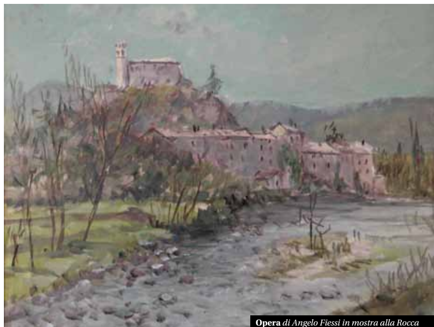
Opera di Angelo Fiessi in mostra alla Rocca

Fiessi è un pittore bresciano appartenente al gruppo della Scapi-