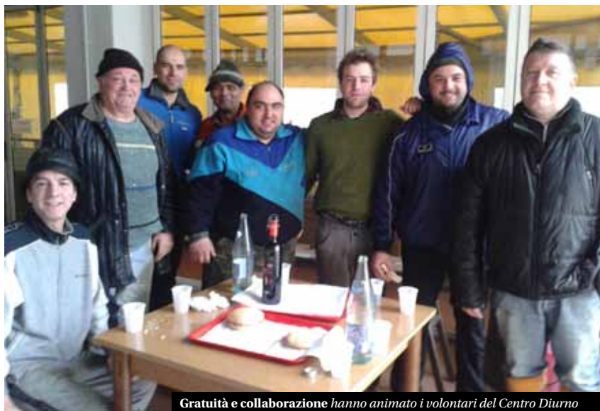
Gratuità e collaborazione hanno animato i volontari del Centro Diurno