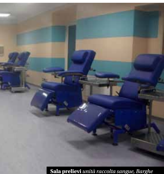
Sala prelievi unità raccolta sangue, Barghe

In questo contesto non vi è terreno più fertile come la scuola per orientarci a muovere i nostri passi e costruire in essa persone sempre più consapevoli e testimoni di valori positivi. ■