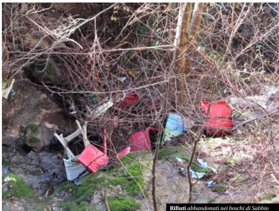
Rifiuti abbandonati nei boschi di Sabbio