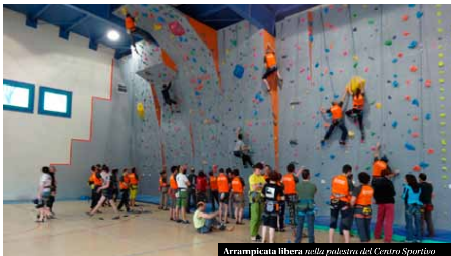
Arrampicata libera nella palestra del Centro Sportivo

L’appuntamento è giunto alla quarta edizione ed è diventato ormai un appuntamento fisso, vista anche la modalità con cui viene proposto