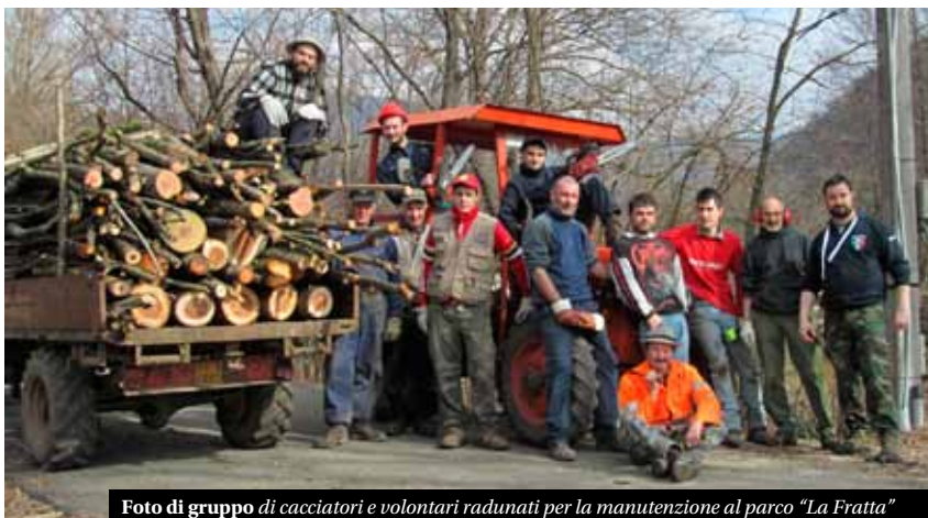
Foto di gruppo di cacciatori e volontari radunati per la manutenzione al parco "La Fratta"