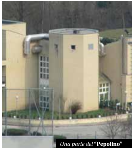
Una parte del "Pepolino"

pattuito in 36.000 € oltre IVA, da pagarsi in ragione di rate mensili pari a 3.000 oltre IVA. A tale accordo faceva seguito, in data 24 Aprile 2013, la stipula di un contratto di subaffitto dell'azienda, previa autorizzazione del Comune, tra la società GRA di Bertazzoni e l'impresa individuale Pizzeria da Asporto il Girasole di El Sayed M.