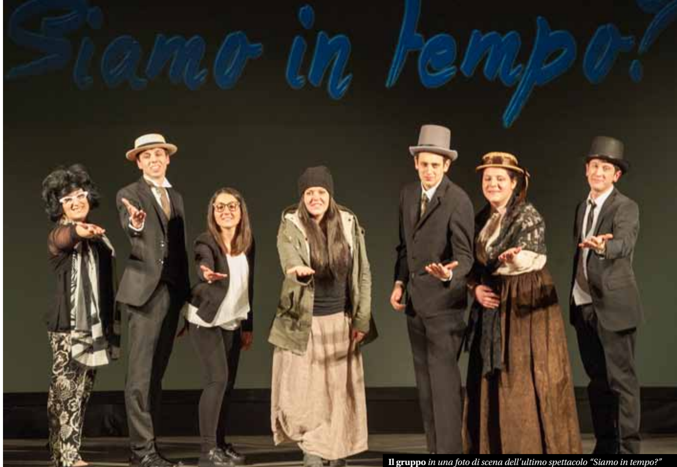
Il gruppo in una foto di scena dell'ultimo spettacolo "Siamo in tempo?"

di livellamento sociale e culturale che vuole zittire chi è diverso, chi racconta la verità. Il teatro è anche una forma di denuncia e di protesta, è garante di libertà, fin dai tempi più antichi. Se abbiamo dato a qualcuno il modo di scandalizzarsi è perché è la società moderna che abbiamo rappresentato ad essere scandalosa: in teatro non esistono tabù ed ogni cosa viene amplificata per risvegliare dal torpore la coscienza critica degli spettatori, dando loro la possibilità di distinguere ciò che è giusto da ciò che non lo è.