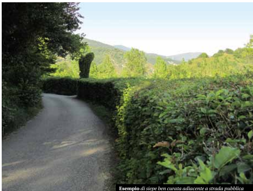
Esempio di siepe ben curata adiacente a strada pubblica

L'intenzione dell'Amministrazione Comunale per l'anno 2015 è quella di rafforzare i controlli e fissare per il 15 giugno 2015 la nuova scadenza per il taglio di rami e siepi prospicienti le strade comunali e vicinali. L'eventuale inadempienza dei doveri entro tale data verrà sanzionata a termini di legge in base a quanto previsto. ■