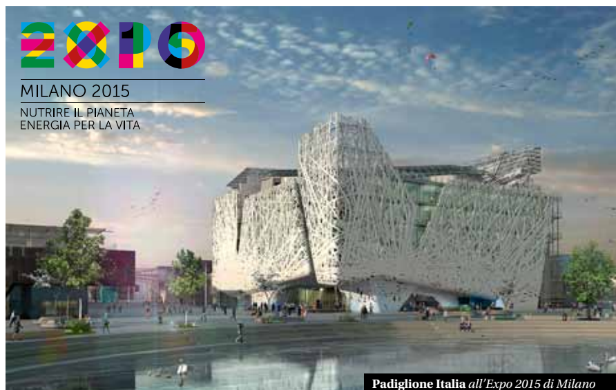
Padiglione Italia all'Expo 2015 di Milano

La prima esposizione universale si è tenuta a Londra, nel Crystal Palace, nel 1851 e ha spinto successivamente altre nazioni a organizzare la stessa iniziativa, come quella a Parigi del 1889, ricordata per la Tour Eiffel. Ogni Esposizione Universale è dedicata a un tema di interesse universale. ■