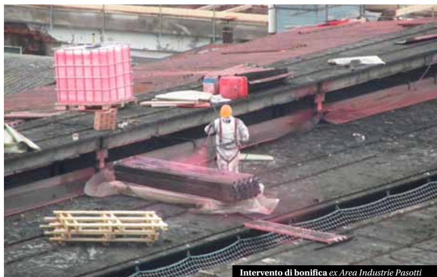
Intervento di bonifica ex Area Industrie Pasotti

È pericoloso essenzialmente perché le fibre di amianto molto sottili, tendono a sfaldarsi dividendosi longitudinalmente, rimangono sospese in aria e vengono respirate. È quindi necessario ridurre il più possibile l'inalazione e non disperderle