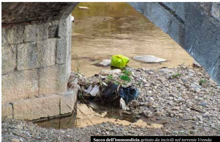
Sacco dell'immondizia gettato da incivili nel torrente Vrenda

Lo smaltimento dei rifiuti è un costo che colpisce in maniera incisiva tutti i cittadini; la negligenza e maleducazione di coloro che non rispettano i regolamenti non fa altro che aumentare questi costi oltre che generare, sul territorio, contaminazioni dannose alla nostra salute, alla flora, alla fauna e all'ambiente circostante, creando, inoltre, un cattivo decoro del paese. ■