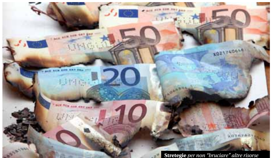
Strategie per non "bruciare" altre risorse

Siamo convinti che sia necessario fare ogni sforzo possibile per