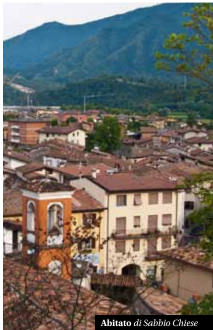
Abitato di Sabbio Chiese

Tutti noi abbiamo un'idea più o meno precisa di quella che è l'atti-