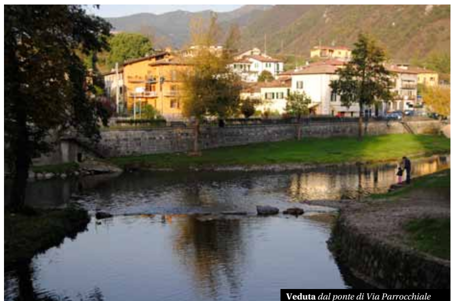
Veduta dal ponte di Via Parrocchiale