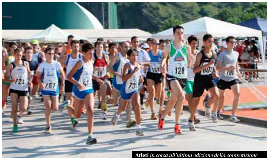
Atleti in corsa all'ultima edizione della competizione

Al giorno d'oggi avvicinarsi alla corsa, in pista o su strada, richiede uno sforzo notevole. Abbiamo chie-