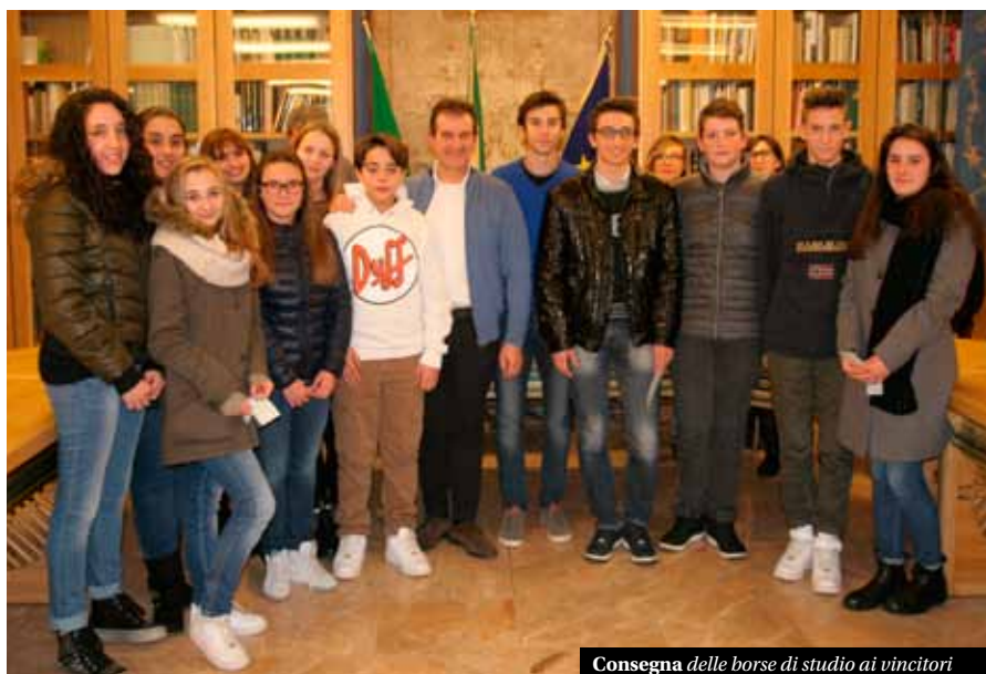
Consegna delle borse di studio ai vincitori