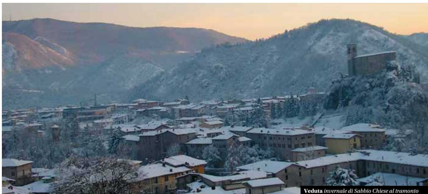
Veduta invernale di Sabbio Chiese al tramonto

attività produttive e commerciali e le associazioni, nella raccolta di contributi e proposte, per far sì che gli obiettivi del nuovo PGT rispecchino il più possibile i valori e le aspettative della popolazione. Partecipare al processo formativo ed esprimere in modo attivo il proprio punto di vista significa essere di stimolo all'Amministrazione e portare nuove idee nell'interesse di tutti, incidendo così sui contenuti e sulle azioni che saranno individuate.