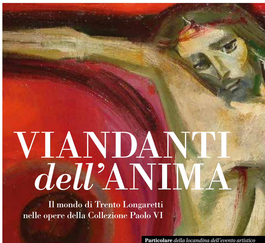
Particolare della locandina dell'evento artistico

Se la scelta cromatica e la ricorrenza dei soggetti ricorda le lontane esperienze del primo Picasso, ma anche del Rouault del Miserere - come nota Paolo Sacchini, neodirettore del museo di Concesio e curatore del catalogo e della mostra - la peculiarità del messaggio di Longaretti è data dal rifiuto tanto di toni drammatici, quanto di appigli aneddotici. "...i viandanti longarettiani non sono mai e poi mai disperati , ma al contrario mantengono