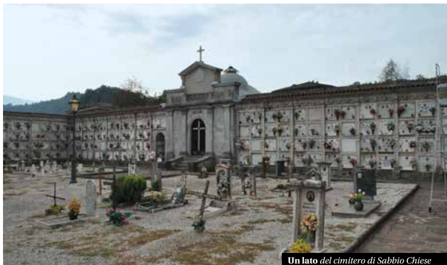
Un lato del cimitero di Sabbio Chiese

importante progetto di riqualificazione cimiteriale, condotto in questi mesi dagli Uffici Comunali in collaborazione con consulenze esterne. Non è quindi un caso se nell'approccio ad un argomento così delicato abbiamo voluto acquisire buona parte del materiale storico ed archi-