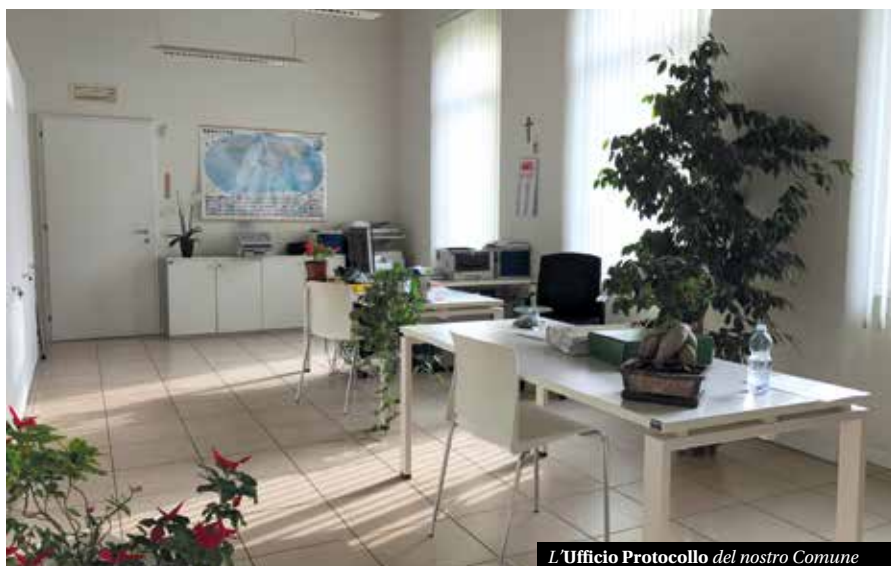
L'Ufficio Protocollo del nostro Comune