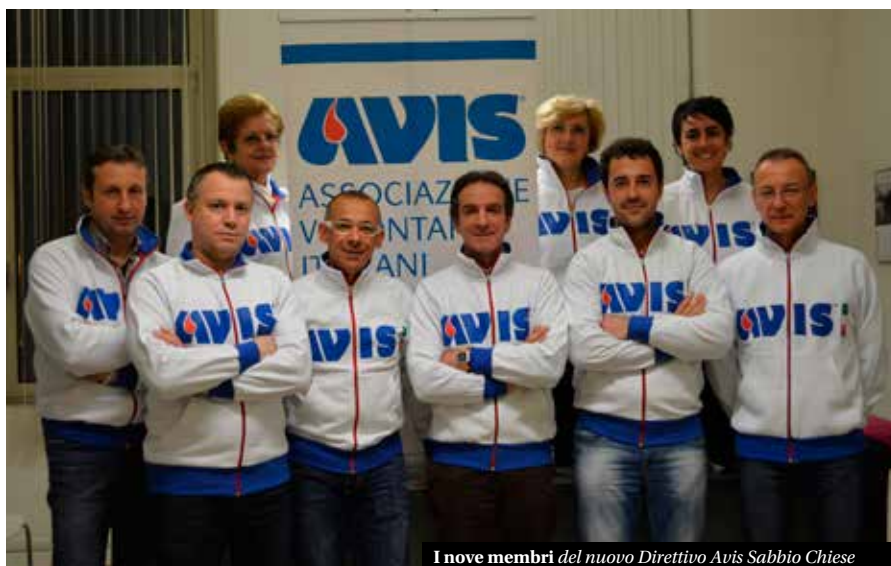
I nove membri del nuovo Direttivo Avis Sabbio Chiese

227 le donazioni di sangue registrate nell'arco dell'anno; 109 i soci tesserati (26 donne e 83 uomini); 21 nuovi donatori a fronte di 12 avisini sospesi in veste definitiva per raggiunti limiti di età e/o per motivi di salute; 63 le visite mediche effettuate dal direttore sanitario Dott. Galvani. E' il quadro sommario di un'associazione che da 37 anni a Sabbio Chiese riveste un'attenzione e una partecipazione molto attiva. Il risultato positivo si è concretizzato nel 2016 con l'indice donazionale di 2,08 ossia quel valore medio di 2 donazioni effettuate da ciascun avisino su 4 appuntamenti programmati nell'anno. E per garantire la gestione dei numeri in aumento sui vari fronti, la collaborazione con Avis Provinciale e con le sezioni Avis Valsabbine, ha portato la nuova sede Unità di Raccolta Sangue a Barghe, a un importante