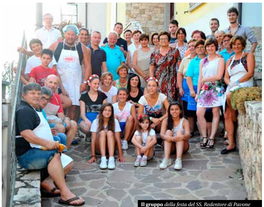
Il gruppo della festa del SS. Redentore di Pavone

Ovviamente... anche quest'anno vi aspettiamo numerosi! ■