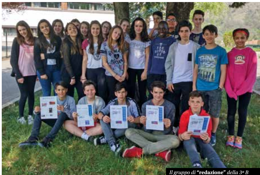
Il gruppo di “redazione” della 3 a B

Quello che ci dispiace, però, è che non sappiamo se qualcuno dei ragazzi più giovani vorrà continuare questo lavoro. Speriamo infatti che qualcuno, quando noi saremo già alle superiori, prosegua con la scrittura del giornalino, perché sarebbe davvero un peccato chiudere così questa esperienza. ■