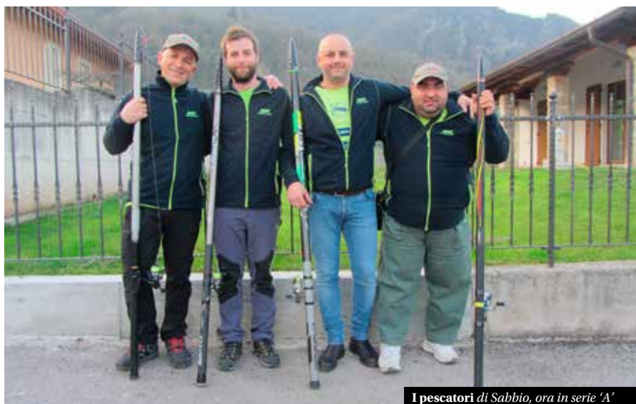
I pescatori di Sabbio, ora in serie 'A'

Non sarà facile, ma noi ci saremo e non staremo di certo a guardare. ■