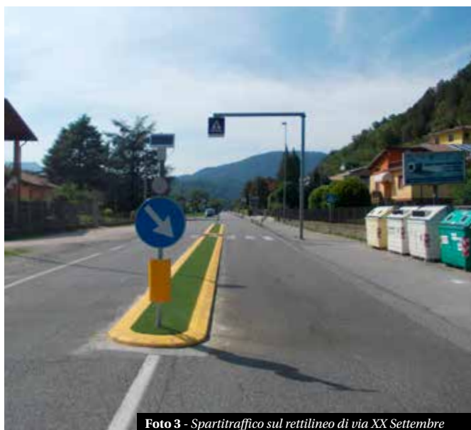
Foto 3 - Spartitraffico sul rettilineo di via XX Settembre