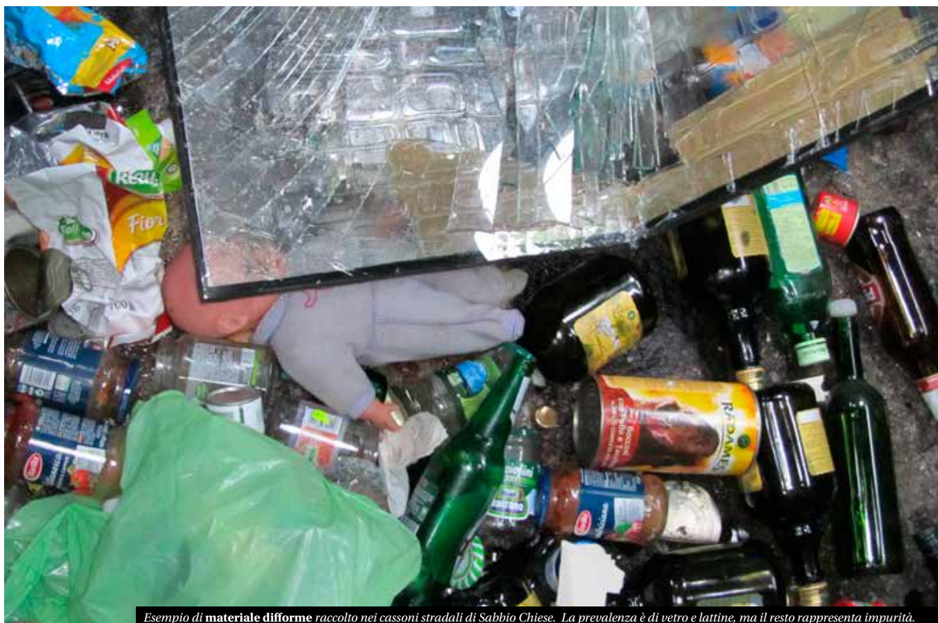
Esempio di materiale difforme raccolto nei cassoni stradali di Sabbio Chiese. La prevalenza è di vetro e lattine, ma il resto rappresenta impurità.

sonetti stradali, apribili con chiave elettronica, per la raccolta dell'indifferenziato (chiamato anche secco o RSU) e dell'umido (detto anche FORSU) mentre, per carta/cartone, plastica, lattine e vetro, il sistema prevede il ritiro manuale a domicilio tramite operatori; tale metodo è chiamato, per questo motivo, raccolta "porta a porta".