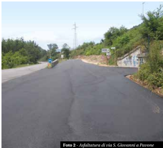
Foto 2 - Asfaltatura di via S. Giovanni a Pavone