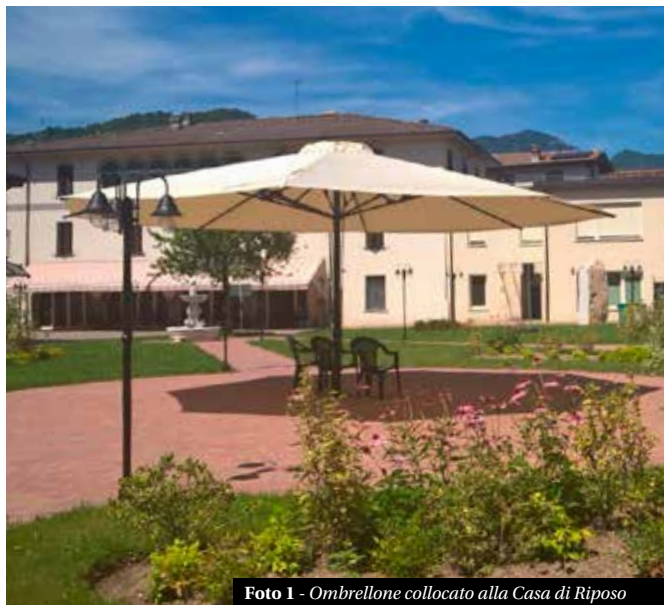
Foto 1 - Ombrellone collocato alla Casa di Riposo