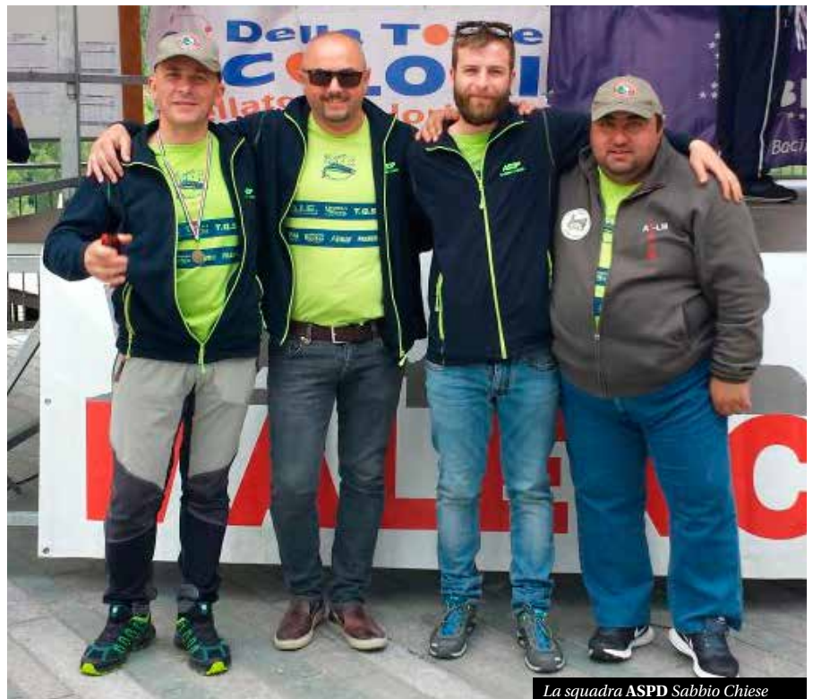
La squadra ASPD Sabbio Chiese

Ringraziamo tutti quelli che ci aiutano e ci sostengono e ora attendiamo il 2018 per un altro entusiasmante anno di pesca. ■