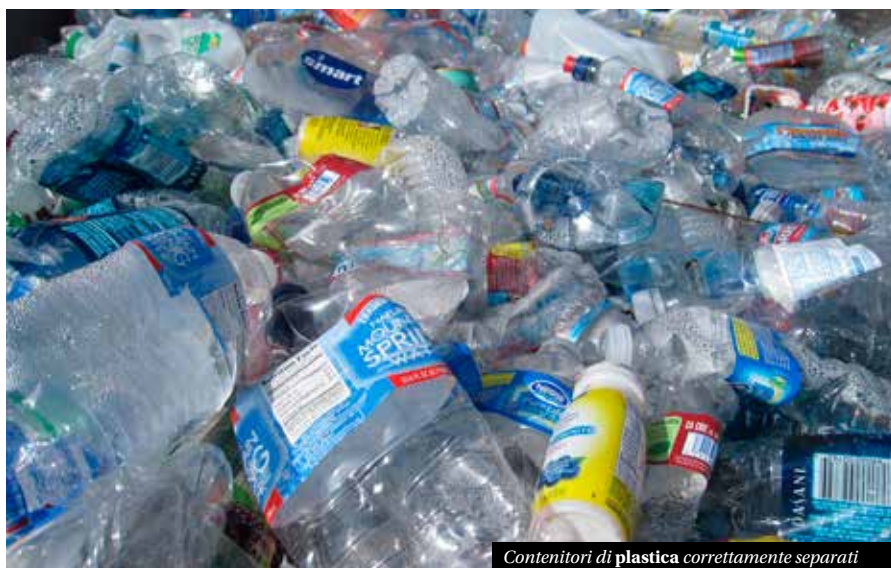
Contenitori di plastica correttamente separati

Si ricorda che il Comune di Sabbio Chiese, come altri comuni della valle, è orientato ad adottare una strategia di raccolta "porta a porta" con sistema "misto" ovvero il metodo che prevede la presenza di cas-