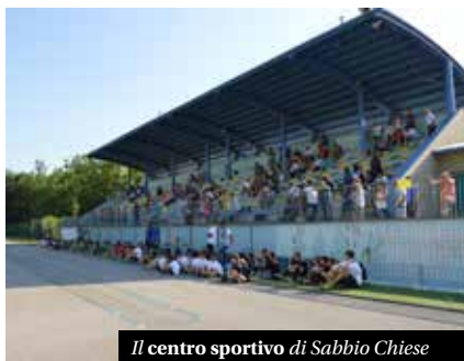
Il centro sportivo di Sabbio Chiese

L'associazione conta 10 squadre: attività di base, di cui fanno parte la scuola calcio e tre squadre di pulcini, due squadre esordienti, due