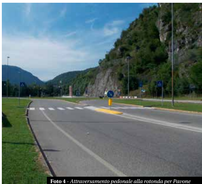
Foto 4 - Attraversamento pedonale alla rotonda per Pavone