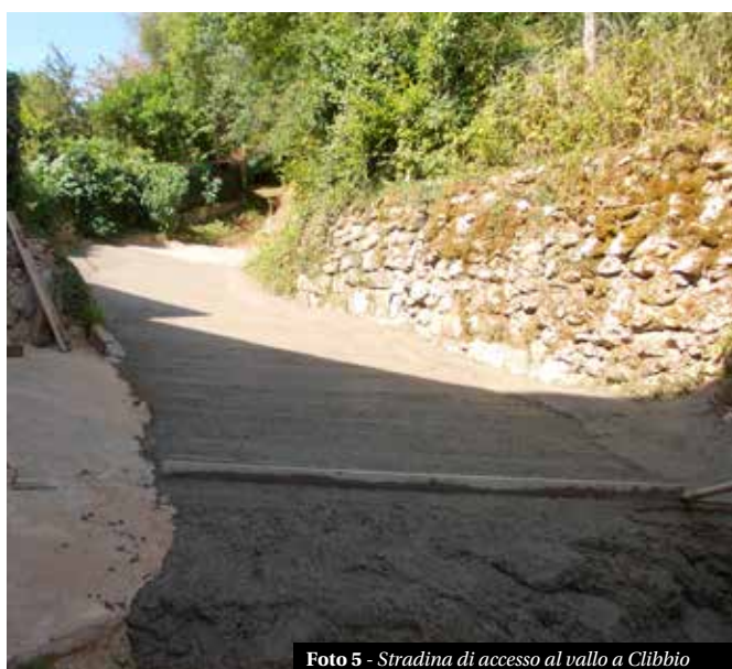
Foto 5 - Stradina di accesso al vallo a Clibbio