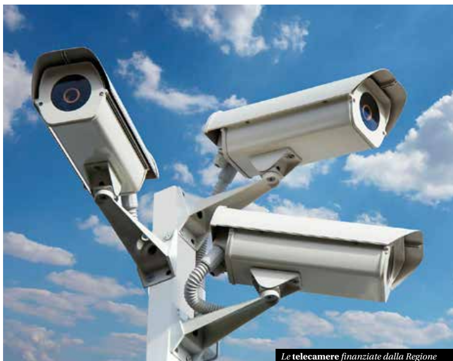
Le telecamere finanziate dalla Regione