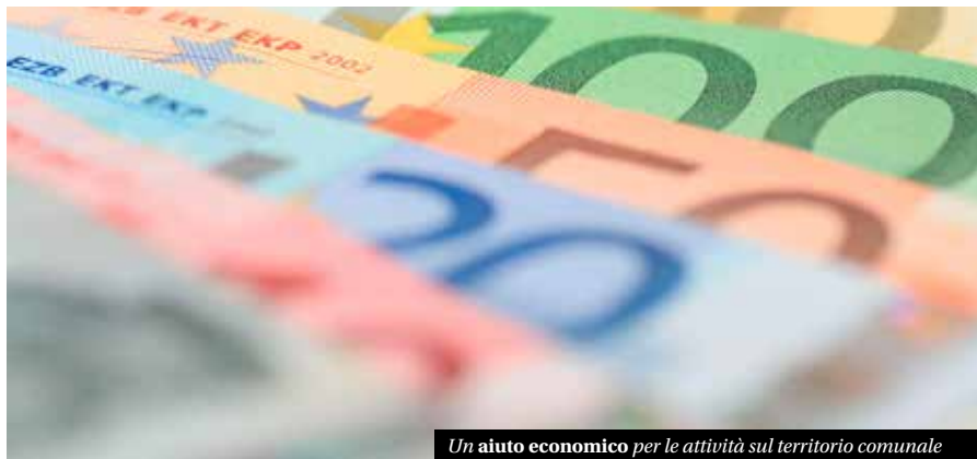
Un aiuto economico per le attività sul territorio comunale