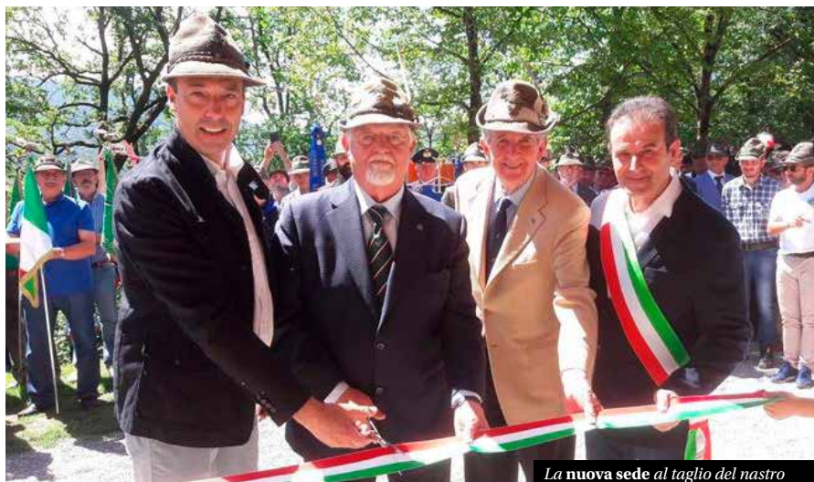
La nuova sede al taglio del nastro