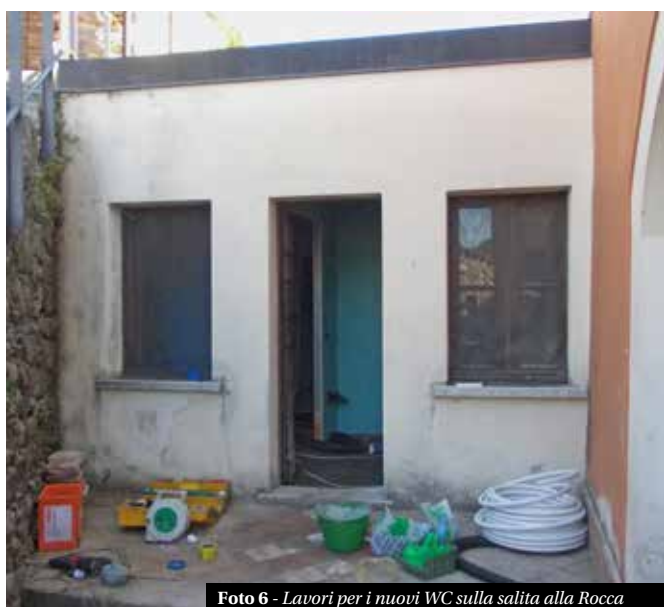
Foto 6 - Lavori per i nuovi WC sulla salita alla Rocca