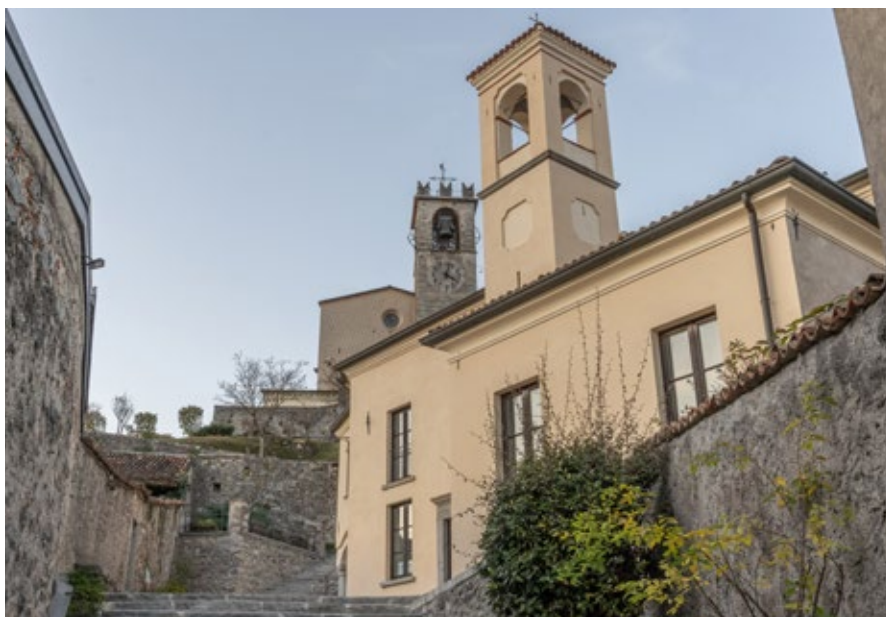
L'ex chiesetta di San Nicola, ora sede museale, dopo la ristrutturazione

Si ha oggi la certezza che la chiesetta di San Pietro e quella di San Nicola siano la medesima Chiesa, poiché nel 1636 nella chiesa di San Pietro venne insediata la confraternita di San Nicola da Tolentino, della regola degli Agosti-