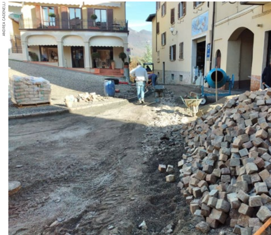
Lavori per il rifacimento della pavimentazione di piazza Rocca

ta sulla ex provinciale, sia per il fatto che ci siano diverse abitazioni ai due lati della carreggiata che causano uno spostamento di persone da una parte all'altra della strada. Inoltre, sempre in quel punto, sono presenti fermate delle corriere pubbliche di linea. Per tutti questi motivi, dopo il via libera della Soprintendenza, l'Amministrazione Comunale ha potuto procedere con l'installazione del semaforo pedonale a chiamata. Da tempo i cittadini avevano chiesto un intervento di questo tipo, perché attraversare la strada in quella zona è ogni volta pericoloso. Quadro economico del progetto comprensivo di Opere, I-va, Oneri Sicurezza 34.772,00 €.