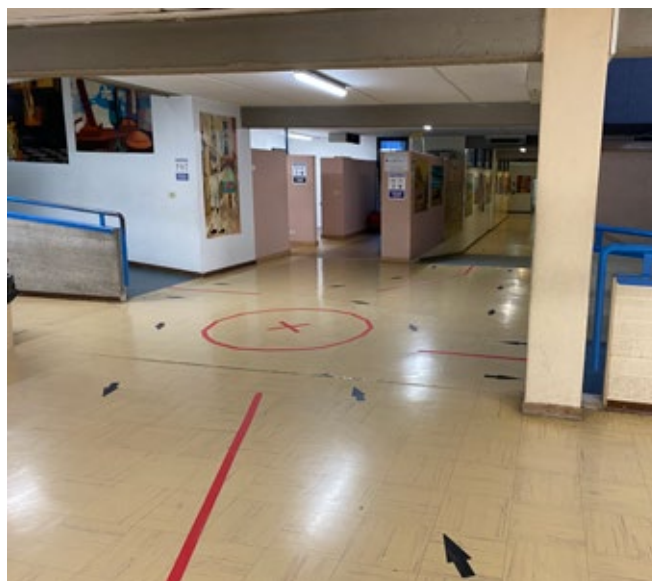
Le indicazioni a terra, parte delle misure anti-Covid adottate

L'integrazione al Patto educativo di corresponsabilità, in merito alle misure di contenimento dell'epidemia, prevede che le famiglie monitorino sistematica-