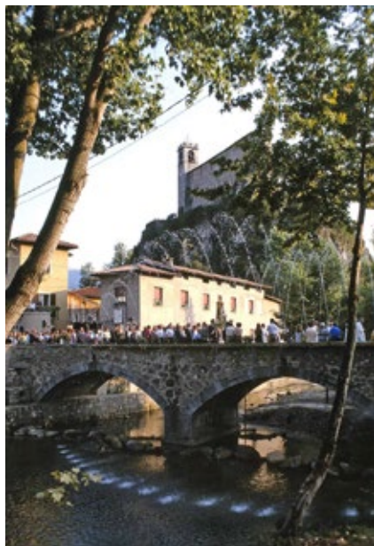
Ponte sul Chiese, Decennali 1992

pliando molto verso le zone periferiche, con nuovi residenti provenienti da altri comuni, ma siamo certi che la passione e il desiderio di celebrare degnamente le feste decennali alla fine contagerà tutti.