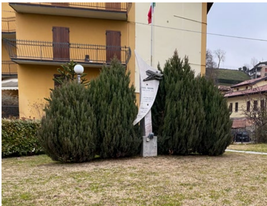
Monumento in via XX Settembre, dedicato a Roul Simonini

Se in certe situazioni può prevalere la quantità dell'aiuto, anche per il volontario la qualità della prestazione è più importante che mai. Questo vale per l'ex pilota che guida un'ambulanza da volontario come per l'ex specialista che accompagna la scolaresca nel-