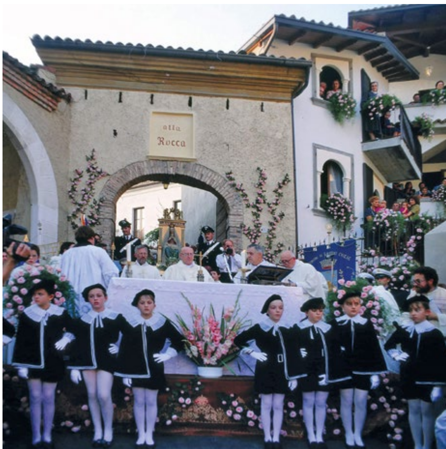
La discesa dalla Rocca della statua della Madonna, Feste Decennali del 1992

Un'ottantina di persone in totale, che metteranno a disposizione della comunità le proprie energie per muovere al meglio la macchina organizzativa. Durante la prima riunione della nuova Commissione che ha avuto luogo il 20 febbraio 2020 sono state prese