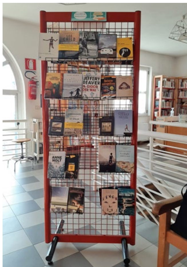
L'espositore delle novità letterarie in Biblioteca

Abbiamo riorganizzato le nostre attività più e più volte, ideato incontri di lettura online con il nostro gruppo di lettura "Fuori di Testo", organizzato Biblio-parco per bambini 6-10 anni presso il prato comunale in via Caduti, creato bibliografie estive per grandi e piccini. Nel mese di settembre abbiamo partecipato al bando del MiBACT a sostegno dell'editoria e abbiamo ottenuto un bonus di acquisto libri per un valore di euro 5000 che abbiamo speso presso quattro diverse librerie del nostro territorio: Nuova Libreria Rinascente di Brescia, Punto Einaudi di Brescia, Orso Pilota