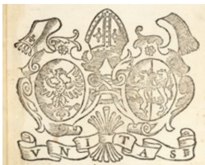
Una delle immagini riprodotte sul calendario

La terra è di chi la ama, la comprende e se la porta nel cuore ovunque vada, proprio come gli stampatori protagonisti di questo calendario, fedeli a Sabbio nel nome, stampato come segno inconfondibile di