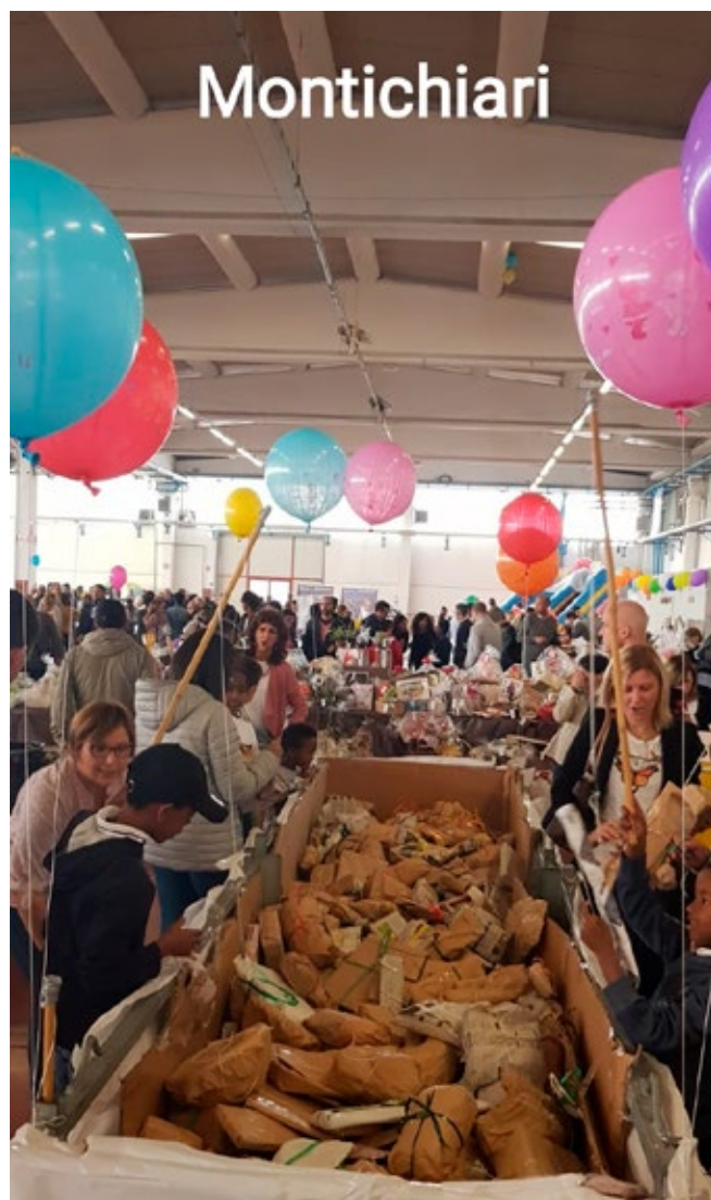
Una passata edizione del mercatino di Montichiari

Ringraziamo le persone che in questi anni hanno dedicato tempo alla realizzazione di progetti per la raccolta fondi, donato oggetti e denaro, acquistato