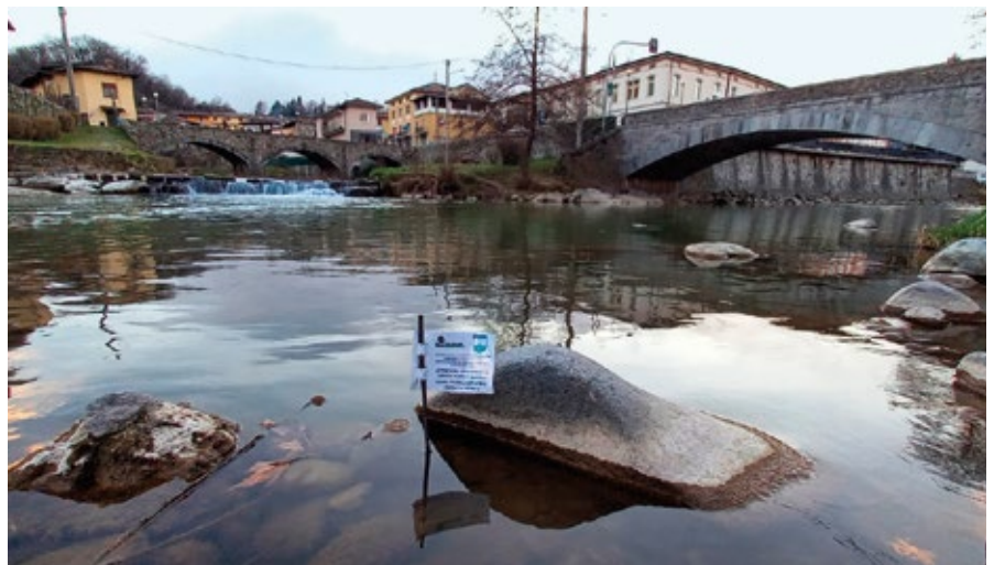
Una postazione sul fiume Chiese che ospita le uova di trota Marmorata

Dopo lo stop di tutte le attività, anche agonistiche, dovuto all'emergenza COVID, quest'anno seppur con le dovute e necessarie cautele, i campionati di pesca si disputeranno e noi non mancheremo. La voglia di praticare il nostro sport preferito è davvero tanta come lo è la speranza che tutta questa situazione di emergenza