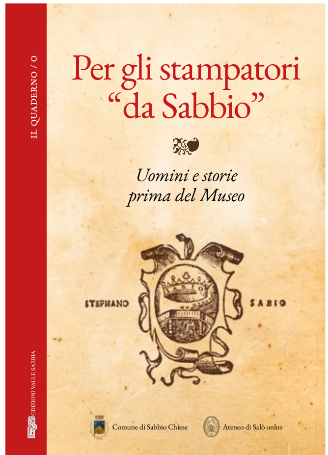
La copertina del volume di recente pubblicazione

La presentazione del volume si terrà il 9 aprile alle ore 17.00 con evento digitale, fruibile tramite il canale YouTube della Biblioteca di Sabbio Chiese. Interver-