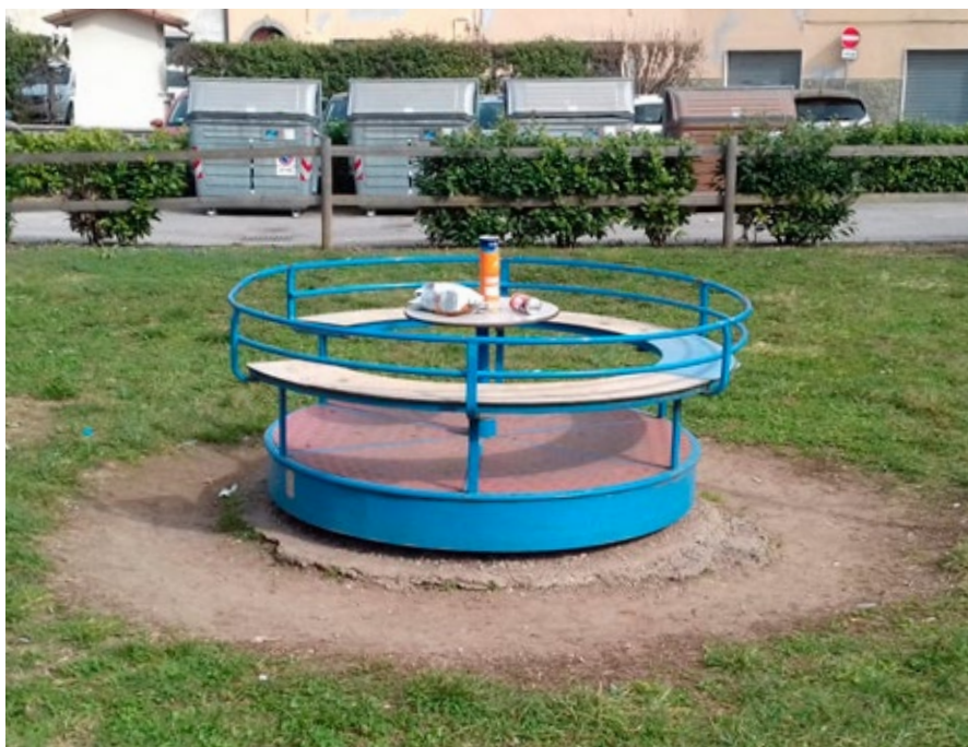
Inciviltà al parco Bertella: rifiuti abbandonati su uno dei giochi

Abbiamo una raccolta dei rifiuti tramite il sistema "porta a porta", l'ausilio dei cassonetti stradali e un'isola ecologia aperta cinque giorni la settimana che aiuta e a-