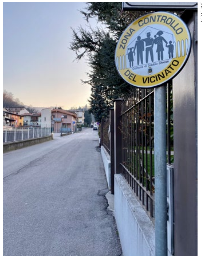
Il segnale di Controllo del Vicinato in via Bertella

Il coordinatore del gruppo avrà il compito di trasmettere le segnalazioni alle Forze di Polizia attraverso i contatti istituzionali. Il protocollo vieta severamente qualsiasi iniziativa personale ovvero qualun-