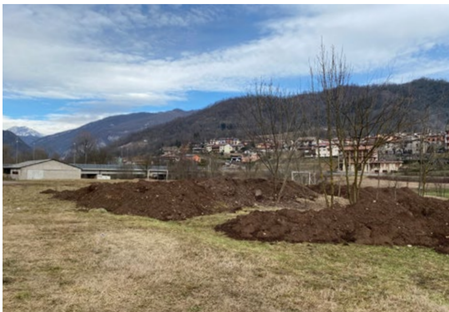
L'area della località “Cleten” futura sede del Parco Sportivo

Sono numerose le associazioni che con i loro volontari stanno aiutando a pulire la zona: il Gruppo Pescatori, gli Alpini, il Gruppo Sportivo Pallaelastica, l'U.S. Sabbio Chiese e i componenti della Commissione Sportiva e della Commissione Ecologia che hanno