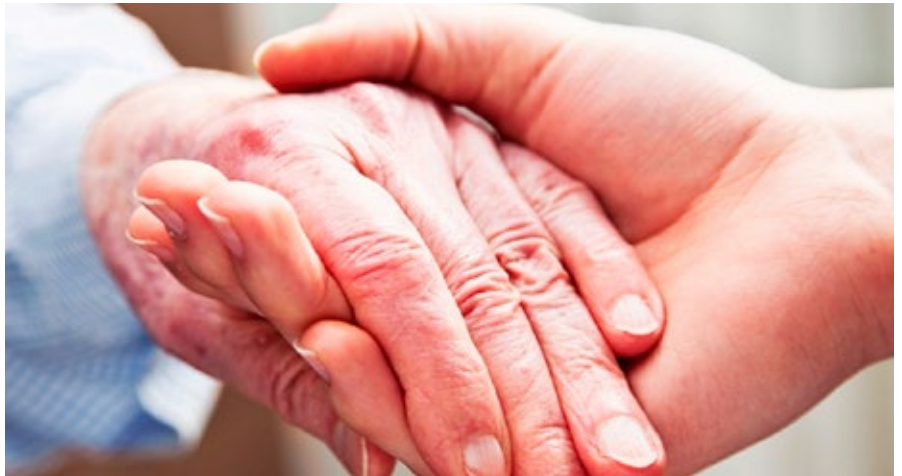
Un aiuto reso possibile dai Volontari dell'Associazione Ambulanza di Sabbio Chiese

Un nuovo servizio di grande utilità per trasportare disabili con invalidità al 100% e persone segnalate dal Servizio Sociale.