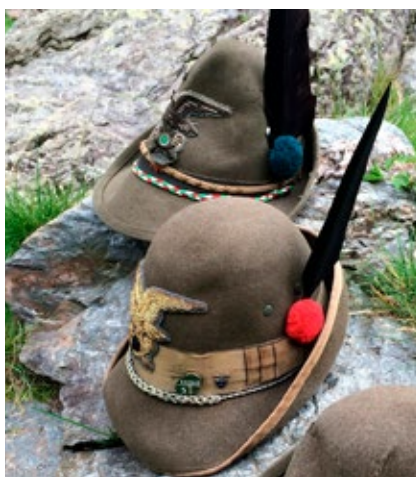
Inconfondibili cappelli d'Alpino

L'anno passato è stato sicuramente uno dei più difficili, non solo per noi alpini, ma per tutte le associazioni di volontariato che operano nel nostro paese, un periodo dove i cambiamenti sono stati quotidiani e dove le iniziative per lo più, se non totalmente, sono state sospese. Il 2020 passerà alla storia sicuramente non solo per il numero spropositato delle vittime